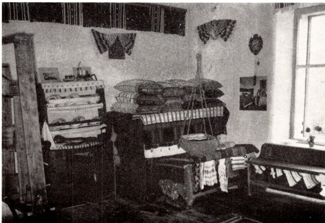
Interior reconstituit la Muzeul din Gura Riului

La rindul său, Muzeul din Avrigh , inaugurat în cadrul manifestărilor „Cibinium 71”, cuprinde o foarte frumoasă colecție de artă populară, cu deosebire textile și port, și obiecte de uz prezentate tematic și funcțional, în 4 încăperi (administrația și un mare număr de cetățeni ai comunei gîndesc să treacă urgent la lucrări de extindere a acestui spațiu, prin contribuție obștească), iar într-o altă sală a fost realizată o prezentare documentară a vieții și operei lui Gheorghe Lazăr. În chiar pivnița casei care adăpostește muzeul, se află organizate standuri, cu vînzare, de țesături populare, lucrate în