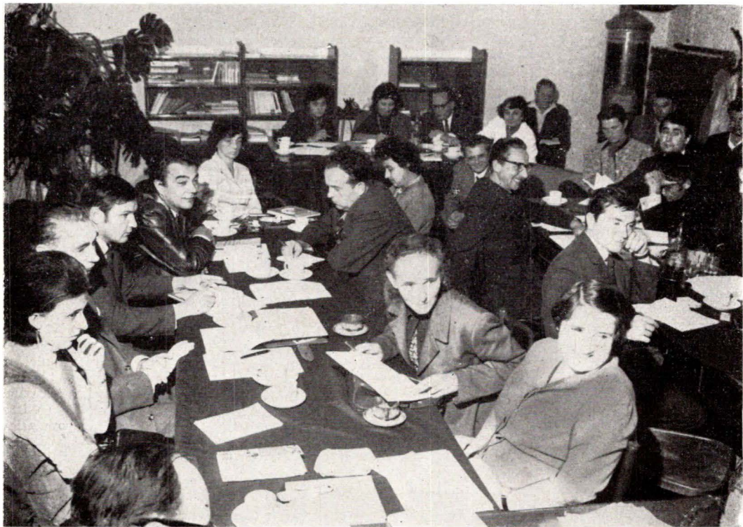
Aspect de la confătuirea din Sibiu

Privită din aceste unghiuri de interes, rețeaua de muzee sătești ar deveni o realitate, constituită echilibrat și diferențiată valoric, obiectiv și nu impusă din afară. Muzeul nu poate deveni o instituție numai printr-un impuls de moment. Odată pus la cale, el devine o datorie asumată și de factorii inițiatori și de colectivitate.