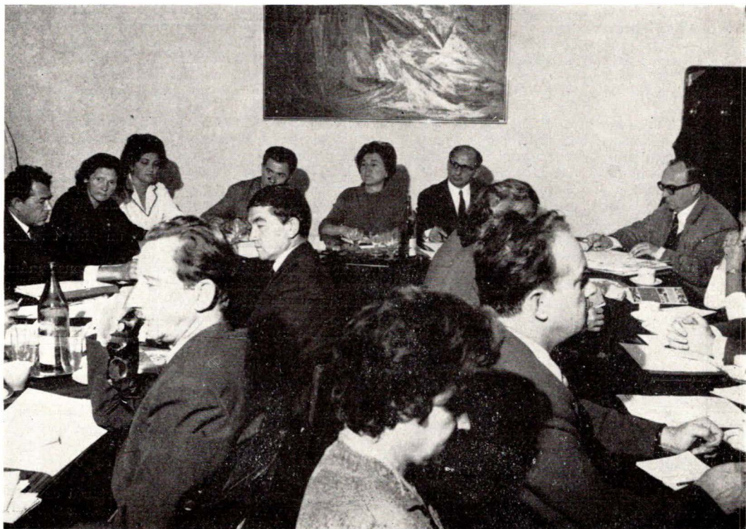
Aspect de la consfătuirea din Sibiu