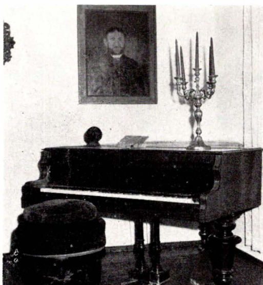
Clavirul lui Bacovia din salonul poetului (Bacău)