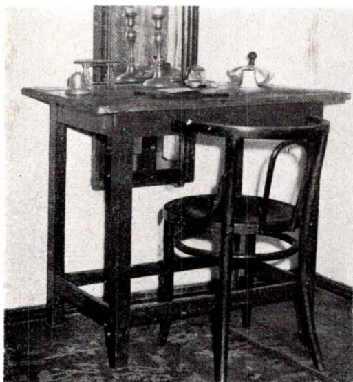
Masa de lucru a poetului (Bacău)