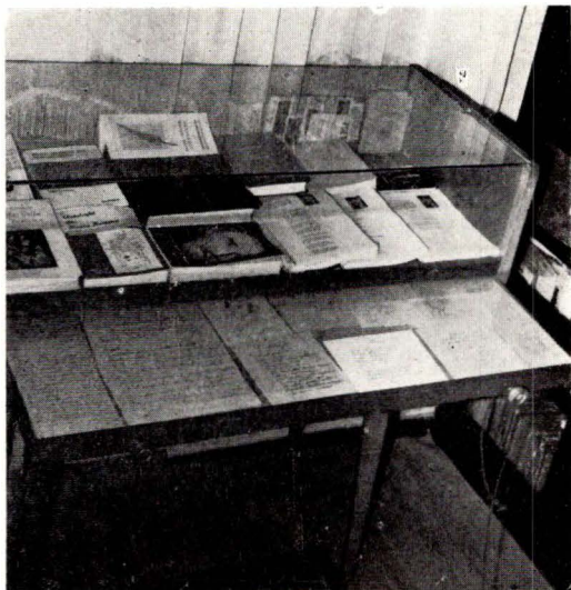
Vitrina din sala de expoziție a Muzeului memorial din București

Reconstituirea întregului ansamblu bacovian al muzeului se datorează în mare măsură poetei Agatha Grigorescu-Bacovia, soția poetului, care izbutind să învingă problemele unei cit mai autentice expunerii pe parcursul aranjării mai are câteva gânduri pentru desăvîrșirea veridicității casei-muzeu, pentru menținerea atmosferei calde bacoviene a lăcașului de unde George Bacovia auzea „ materia plîngînd ”.