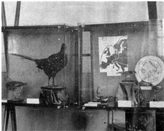
EXPOZIȚIA ITINERANTĂ „PĂSĂRI FOLOSITOARE AGRICULTURII”

măsură și cu succes. Prin intermediul ei s-au prezentat frumuseți ale peisajului dobrogean, bogăția cinegetică, arta populară dobrogeană, relațiile de schimb și influența factorului grecesc asupra localnicilor etc.