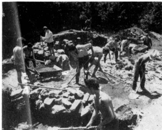
ELEVI PE ȘANTIERUL ARHEOLOGIC DE LA ENISALA