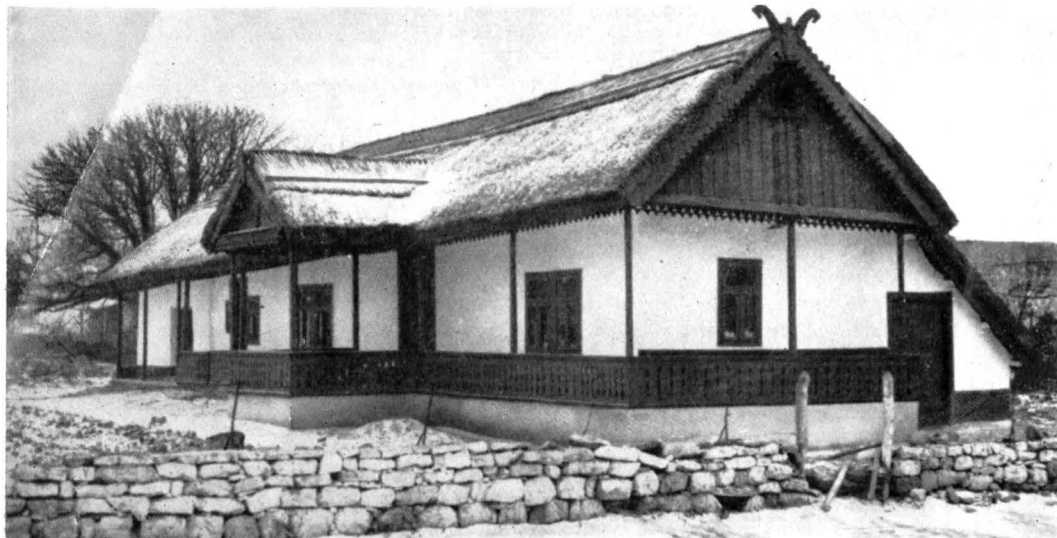
CASA DIN COMUNA ENISALA ÎN CARE A FOST ORGANIZAT UN PUNCT MUZEAL

14. Conservarea așezării întărite hallstattiene și a construcțiilor romane de pe malurile lacului Babadag.