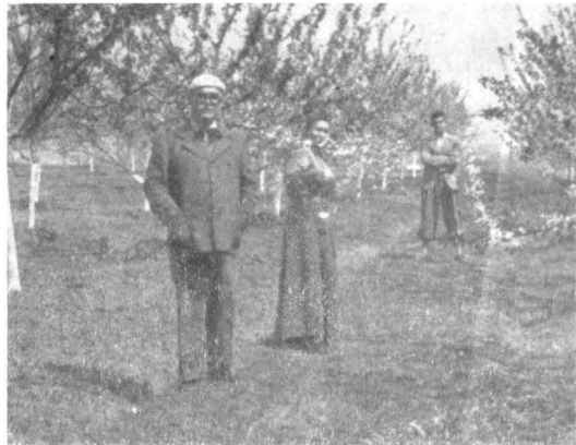
CU ZDREANȚĂ ÎN GRĂDINA CASEI DE LA MĂRȚIȘOR