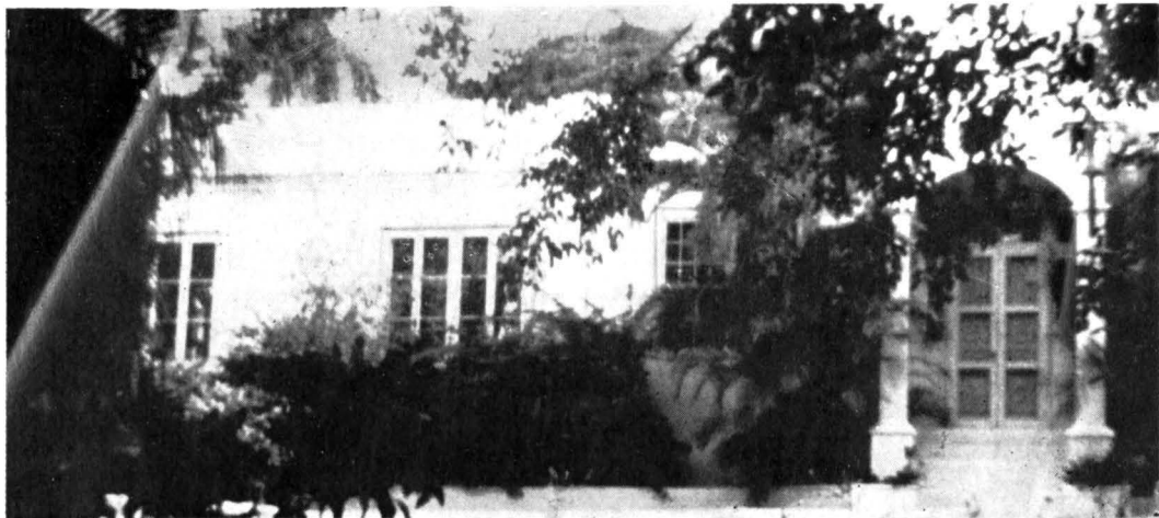
CASA LUI HEMINGWAY