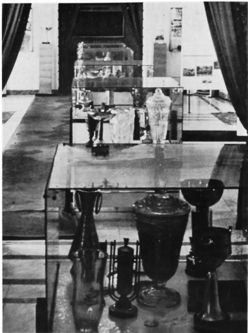
Viteze cu cele mai reprezentative dovezi ale dezvoltării muncii sportive de până anul 1914.