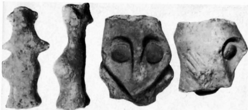
Figurine Vădastra descoperite în așezare văzute din față și din profil

Tot în această fază menționăm un fragment din buza unui vas, din pastă fină, de culoare neagră, ornamentat cu o imagine antropomorfă în basorelief, avînd capul relativ triunghiular și prezentînd steatopigie. Ornamentul este completat cu două șiruri de înfășurări imediat sub buză și cu pliseuri fine. Un fragment ceramic pe care se păstrează partea inferioară a unei reprezentări antropomorfe, cu o înfățișare asemănătoare cu cea din cazul nostru, a fost descoperit la Vădastra 10 .