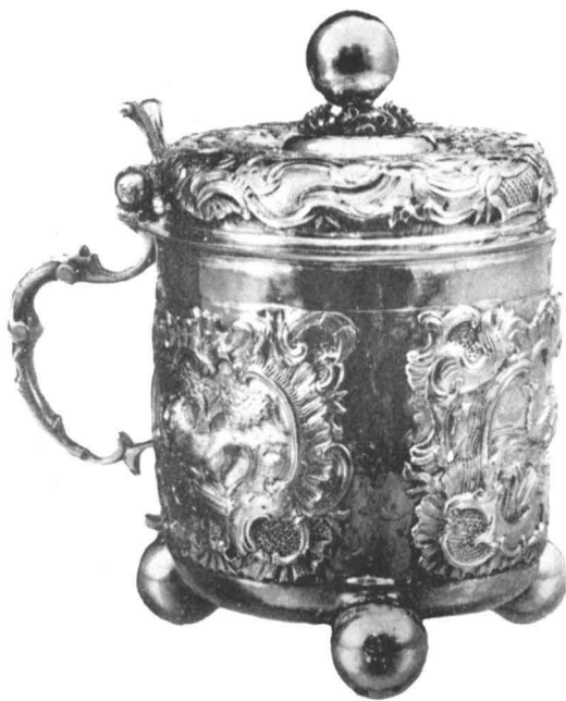
Cană cu capac, din colecția de artă decorativă