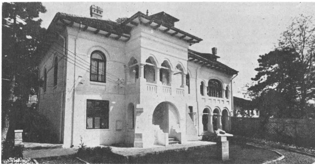
Muzeul Delta Dunării — Tulcea, Secția de artă

Constituită de curind*, Secția de artă a Muzeului Delta Dunării din Tulcea apare ca un nucleu încheiat al unui viitor muzeu de proporții, cu profilul determinat, unic în configurația unei ipotetice hărți a tuturor instituțiilor similare din țară.