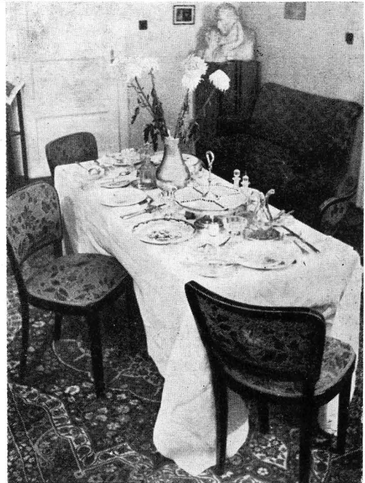
Sufrageria sonelistului, în Casa memorială „Mihai Codreanu” din Iași