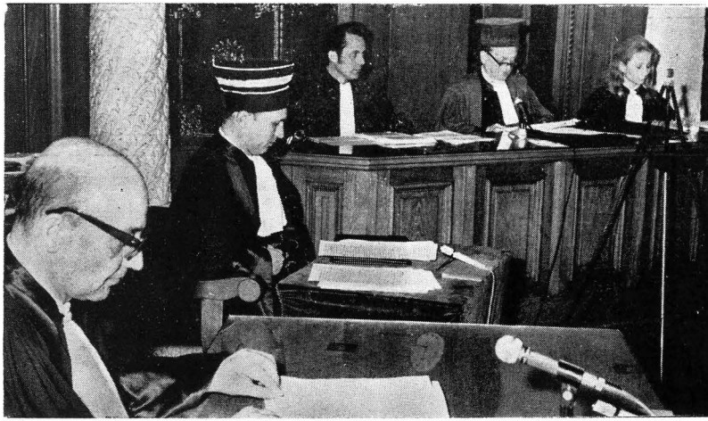
Reconstituirea unui proces literar la Muzeul literaturii române din București