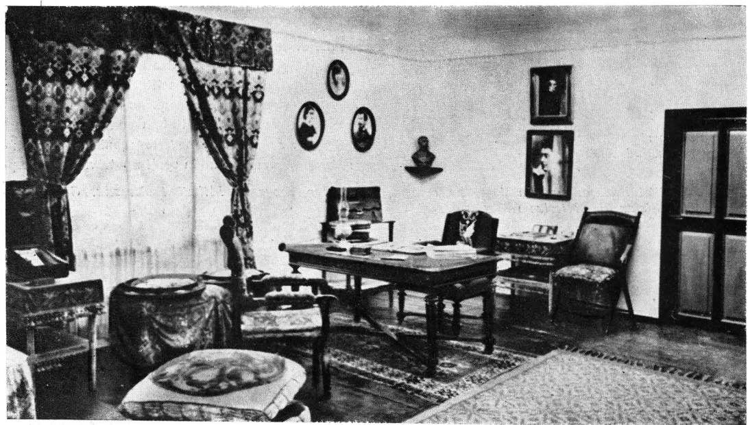
Interior din Casa memorială „Vasile Alecsandri” din Mircești

ția de viață a personalității și cu realitatea epocii. Altfel se va obține un hibrid care, într-adevăr, alterează criteriile și principiile muzeografice și induce în eroare pe vizitatori.