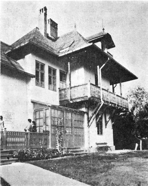
Muzeul memorial „Nicolae Grigorescu” din Cimpina