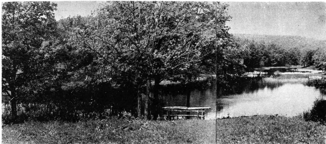
Locuri memoriale: lacul și codrul cîntate de Mihai Eminescu (la cca. 2 km de Ipotești)