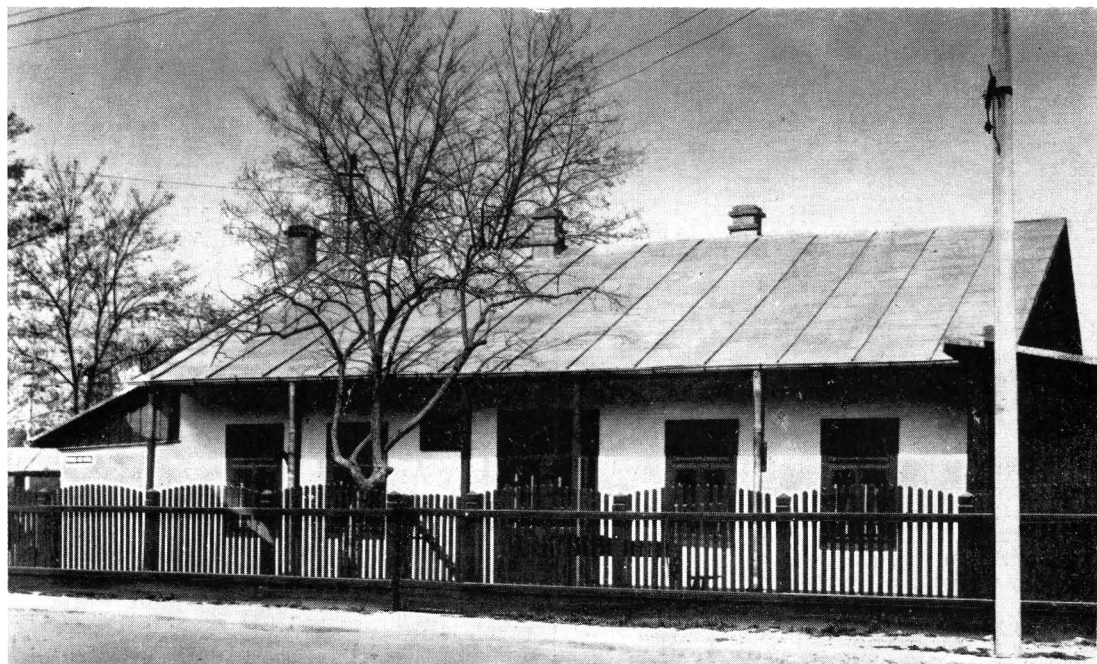
Casa memorială „Ilie Pintilie” din Iași

Dar, după cum am arătat mai sus, muzeograful se poate afla uneori în situația de a nu avea sufi-