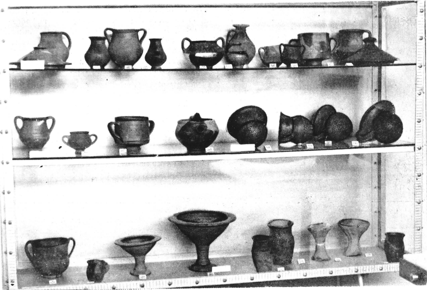
Vase de la Poiana, Răcătău și Brad (Expoziția „Civilizația geto-dacilor din bazinul Siretului”)

lizației grecești le găsim răspândite chiar în zona de confluență a Siretului, la Bărboși și Brăilița, apoi pe valea Buzăului, la Găvani, unde s-a descoperit mormîntul unei căpetenii getice, purtînd coif de luptă de factură grecească. Contactul locuitorilor din cele trei davae de pe Siret cu valorile civilizației grecești a stimulat creația și producția getilor, fapt confirmat de patrimoniul arheologic provenit de la Poiana.