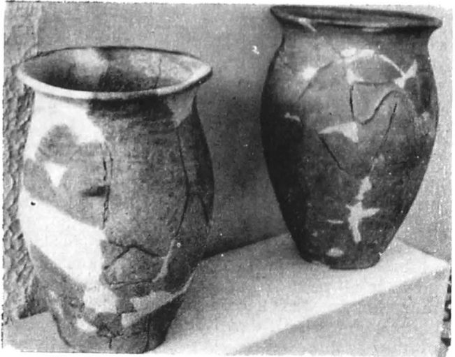
Vase lucrate la mînă, secolele III — II î.e.n., de la Răcătău (Muzeul de istorie și artă Bacău)

Renumele Siretului s-a datorat infloritoareii civilizației a geto-dacilor care a fost reprezentată în antichitate de mai multe așezări de tip oppidan, unde se desfășura o intensă activitate de producție