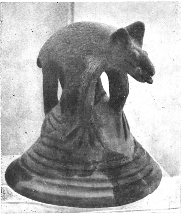
Figurină zoomorșă de la Cîrlomănești (Muzeul județean Buzău)