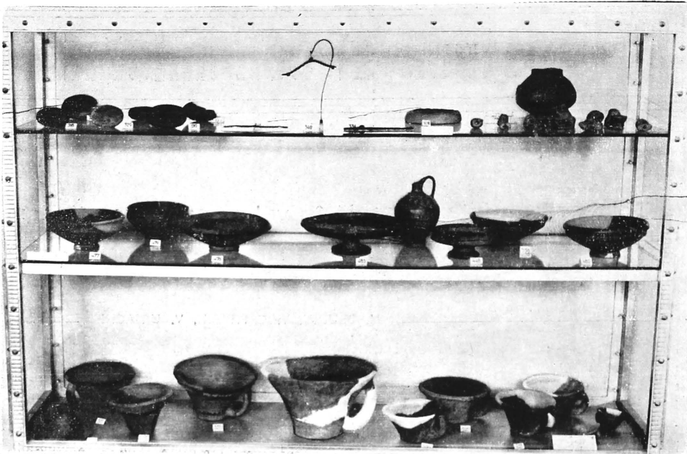
Vestigii geto-dacice din stațiunile Poiana, Răcătău, Brad și Bărboși (Expoziția „Civilizația geto-dacilor din bazinul Siretului“)

geografice foarte diverse începând de la munte, colinele subcarpatice, podiș și pînă la cîmpie și șesurile largi ale Siretului. Aspectul ecologic este de natură să justifice ospitalitatea acestui bazin care a atras la o viață sedentară generațiile mai multor comunități umane și, mai ales, pe acelea aparținînd neamului geto-dacic, precum și faptul că a mijlocit, prin rețeaua afluenților Siretului, legăturile cu zonele vecine, dînd acestor comunități posibilitatea de a se integra în unitatea civilizației geto-dacice.