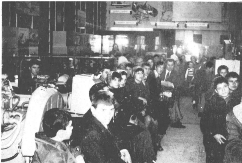
Aspect de la seara muzeală cu tema „Probleme actuale ale cercetării spațiului cosmic” organizată în sălile Muzeului politehnic din Iași.

însoțite de conferințe, simpozioane sau dezbateri pe marginea tematicilor expozițiilor respective. Se remarcă în acest sens activitatea desfășurată de Muzeul de artă al R.S. România, Muzeul de istorie al R.S. România, Muzeul Brukenthal — Sibiu, Muzeul Banatului — Timișoara, Muzeul Deltei Dunării — Tulcea, Muzeul Olteniei — Craiova, Muzeul județean de istorie — Bacău, Muzeul de istorie