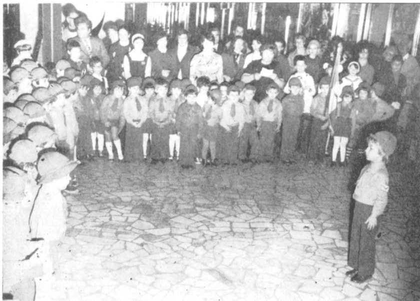
Festivitate de încadrare în organizația „Șoimii patriei” desfășurată în sălile Muzeului de istorie a partidului comunist, a mișcării revoluționare și democratice din România.