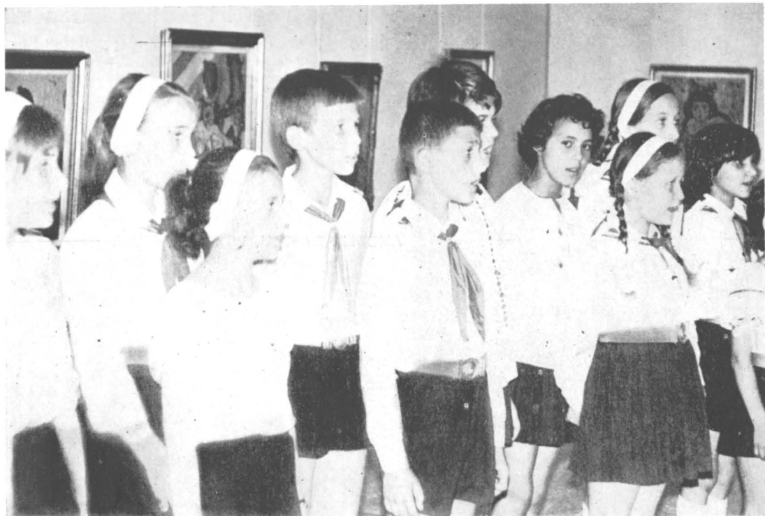
Grup de elevi participanți la lectoratul de istoria artei organizat de Muzeul de artă al R. S. România.

Din cele prezentate se poate afirma că muzeele, prin forme și mijloace specifice, își aduc o importantă contribuție la activitatea partidului pentru educarea și formarea omului nou, pentru ridicarea conștiinței socialiste a maselor. Totodată, lucrătorii din muzee sint conștienți de faptul că au mai rămas încă multe căi nestrăbătute, că se mai găsesc și alte mijloace prin care bogatul și valorosul patrimoniu cultural poate fi folosit mai eficient în opera de înarmare a oamenilor muncii cu concepția revoluționară despre lume și viață, de sădire în sufletele oamenilor a dragostei față de patrie, față de trecutul glorios de luptă al poporului, a hotărârii de a ridica România pe culmile tot mai înalte ale civilizației socialiste și comuniste.