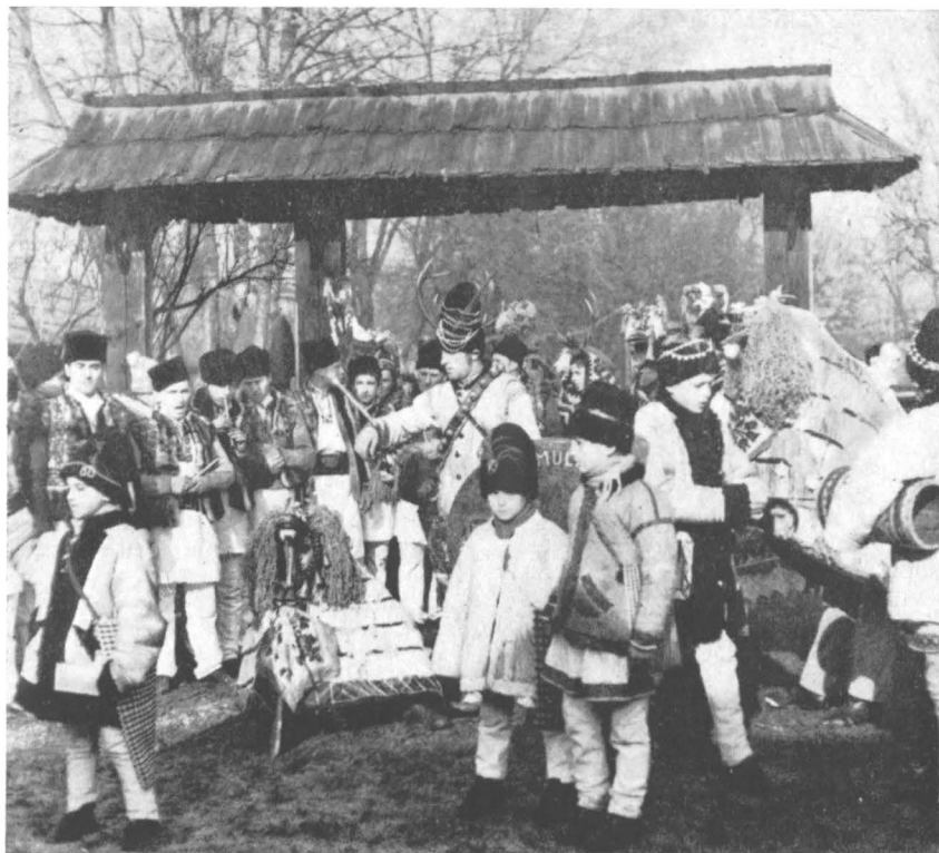
Spectacol folcloric desfășurat la Muzeul satului și de artă populară din București.

Se remarcă, în acest sens, ciclurile de conferințe, simpozioane, urmate de exemplificări și dezbateri în fața exponatelor, vizitele și dezbaterile cu propagandiștii și cursanții din învățământul politico-ideologic, folosindu-se capacitatea de convingere a mărturiilor originale, autentice ale istoriei societății și a naturii, serile muzeale, spectacolele de sunet și lumină organizate la monumente istorice și de artă, cu profunde rezonanțe emoționale, care evocă evenimente importante din istoria patriei, activitatea unor personalități politice, cultural-științifice și artistice. Asemenea acțiuni au fost organizate, cu un deosebit succes la public, la Muzeul de istorie al R.S. România, Muzeul de istorie a partidului comunist, a mișcării revoluționare și democratice din România, Muzeul literaturii române, Muzeul de istorie națională și arheologie Constanța, Muzeul Brukenthal — Sibiu, Muzeul Țării Crișurilor din Oradea, Muzeul Banatului, Muzeul de istorie naturală „Grigore Antipa”, Muzeul de istorie al Transilvaniei, Muzeul satului și de artă populară din București, Complexul muzeal — Iași, Muzeul județean Maramureș, la monumentele istorice din Suceava, Tirgoviște, Hunedoara, Neamț, Drobeta-Turnu Severin, Histria ș.a.