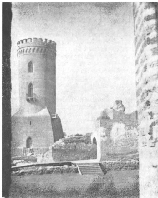
Tîrgoviște: ruinele Curții Domnești și Turnul Chindiei

Preocupările pentru ocrotirea patrimoniului cultural național sînt destul de vechi în țara noastră 3 , prima acțiune organizată de cercetare și cunoaștere a monumentelor istorice avînd loc acum 120 de ani, în 1859, iar în anul 1864, Alexandru Ioan Cuza a aprobat regulamentul de funcționare a Muzeului Național de Antichități și organizarea unui Comitet arheologic, primele instituții oficiale cu rol de cercetare și conservare a bunurilor culturale aflate în pericol de degradare și dispariție