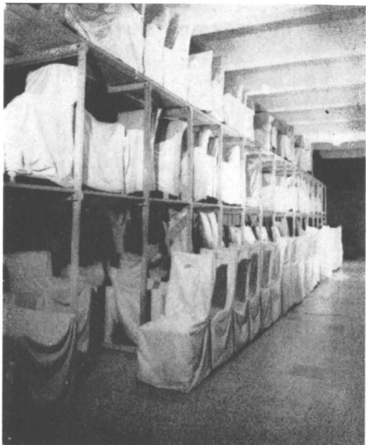
Complexul Posada: depozit de mobilier organizat științific

Pentru aplicarea integrală a prevederilor Legii nr. 63 și realizarea sarcinilor ce decurg din indicațiile date în ședința Comitetului Politic Executiv al Comitetului Central al Partidului Comunist Român din 4 septembrie 1976, s-a elaborat, la nivel central, și s-a transmis în rețea Programul-cadru de acțiune în domeniul conservării și restaurării bunurilor din patrimoniul cultural mobil.