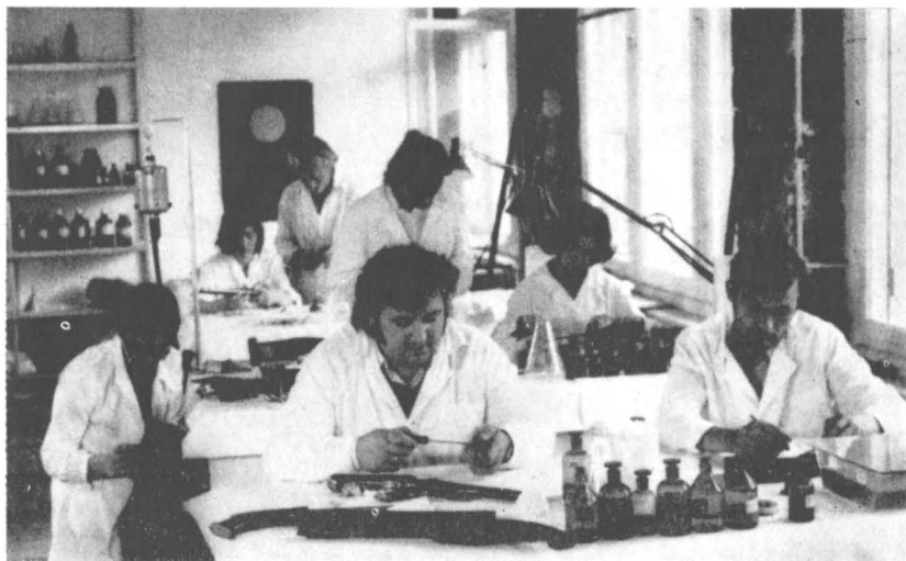
Complexul Posada: aspect de lucru din atelierul de restaurare-conservare metal.

Relevînd principalele aspecte de substanță ale domeniului conservării și restaurării patrimoniului mobil, vom concretiza cu exemplul cel mai edificator, care poate fi considerat un model de referință. Este vorba de experiența restaurării colecțiilor castelului Peleş. Complexitatea rezolvării