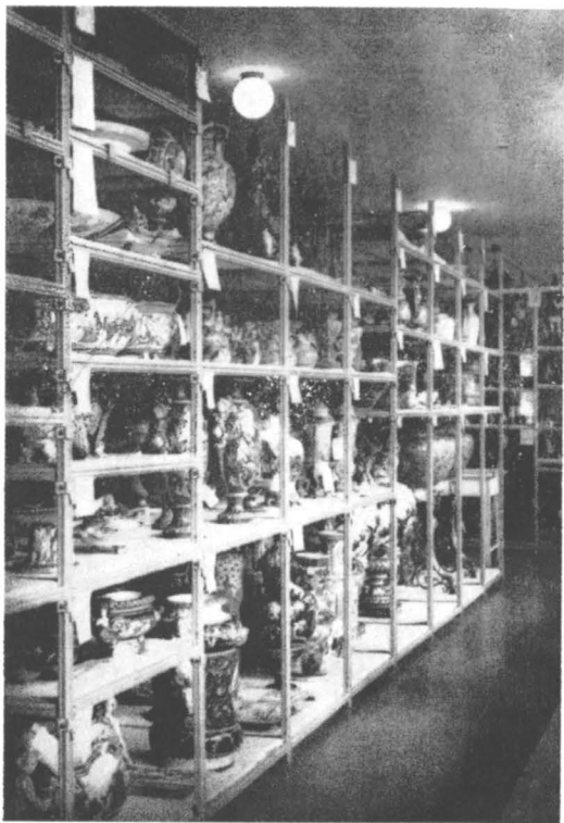
Complexul Posada: depozitarea pieselor de ceramică în conformitate cu principiul dimensionării tip.

S-a conferit astfel activității din acest domeniu un caracter planificat și programatic, stabilindu-se cu precizie priorități și acțiuni cu desfășurare în