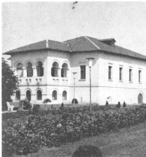
Craiova : Casa Băniei

Conform Legii nr. 63, din patrimoniul cultural național fac parte „bunurile care aparțin, prin valoarea și semnificația lor social-culturală, întregului popor”. Față de aceste bunuri societatea are responsabilități colective, fiind obligată să ia „toate măsurile necesare pentru ocrotirea și conservarea lor, evitarea înstrăinării sau deteriorării, pentru păstrarea, apărarea și folosirea lor în interesul întregii națiuni”. Concepind patrimoniul ca având valori culturale ce depășesc delectarea individuală, legea stabilește că patrimoniul cultural național se constituie din „bunurile cu valoare deosebită, istorică, artistică sau documentară care reprezintă mărturii importante privind dezvoltarea istorică a poporului român și a omenirii în general sau evoluția mediului natural, bucurându-se de protecția statului, a întregii societăți”. Documentele cu caracter de lege stabilesc responsabilitatea egală a tuturor membrilor societății privind păstrarea și ocrotirea patrimoniului cultural național, punând capăt obișnuinței de a plasa acest domeniu în răspunderea exclusivă a unor specialiști și a unor instituții. Stimulându-se astfel răspunderea și vigilența întregii societăți, se întăresc bazele conștiinței colective asupra avuției naționale, iar prin inserția reală a patrimoniului cultural în viața cotidiană, se impulsionează participarea tot mai activă a oamenilor la viața socială.