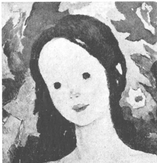
Nicolae Tonitza, Cap de fetiță

sufletul atât de complex, de greu inteligibil al celor mici, învăluind măiestrit obraji bucălați și ochii mari cu neînțelesul „supliciu” al Orgoliu -lui. Aceleași abisuri halucinante le explorează și le modelează și Dimitrie Paciurea, în Cap de copil .