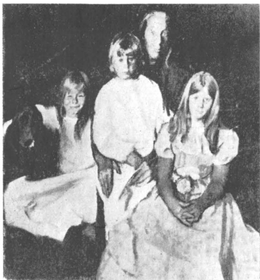
Corneliu Baba, Mamă și copii

sufletul atât de complex, de greu inteligibil al celor mici, învăluind măiestrit obraji bucălați și ochii mari cu neînțelesul „supliciu” al Orgoliu -lui. Aceleași abisuri halucinante le explorează și le modelează și Dimitrie Paciurea, în Cap de copil .