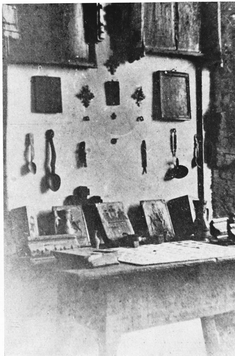
Aspect din prima expoziție a Muzeului din Rădăuți

„Ca să nu-mi fie urît și să pot continua munca pe teren cultural cît timp voi mai fi în stare să aduc neamului și țării foloase, m-am apucat, împreună cu scumpa mea soție, să întemeiez un muzeu etnografic în orașul Rădăuți. Am adus colecțiile noastre din Căndreni care au format temelia muzeului... Întîi l-am așezat în locuința noastră și apoi l-am strămutat într-o cameră de la Școala nr. 2 băieți. De acolo l-am dus în Palatul hergheliei, la etaj, unde am căpătat o sală mare și mai două camere și unde am început cu organizarea definitivă a unui muzeu etnografic” 11 .