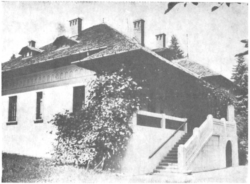
Muzeul memorial „Mihail Sadoveanu” de la Vinători-Neamț, județul Neamț