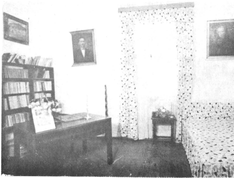
Camera de lucru a scriitorului cu portretele părinților

și chiar milioane de exemplare. Principalele titluri, începînd cu Povestiri , 1904, și terminînd cu Mărturisiri , 1960, încheie prezentarea unei activități de excepție, străbătută de o înaltă exigență și izvorîră în întregime din realitățile noastre naționale, ceea ce-i conferă scriitorului atributul de exponent autentic al genului poporului român.