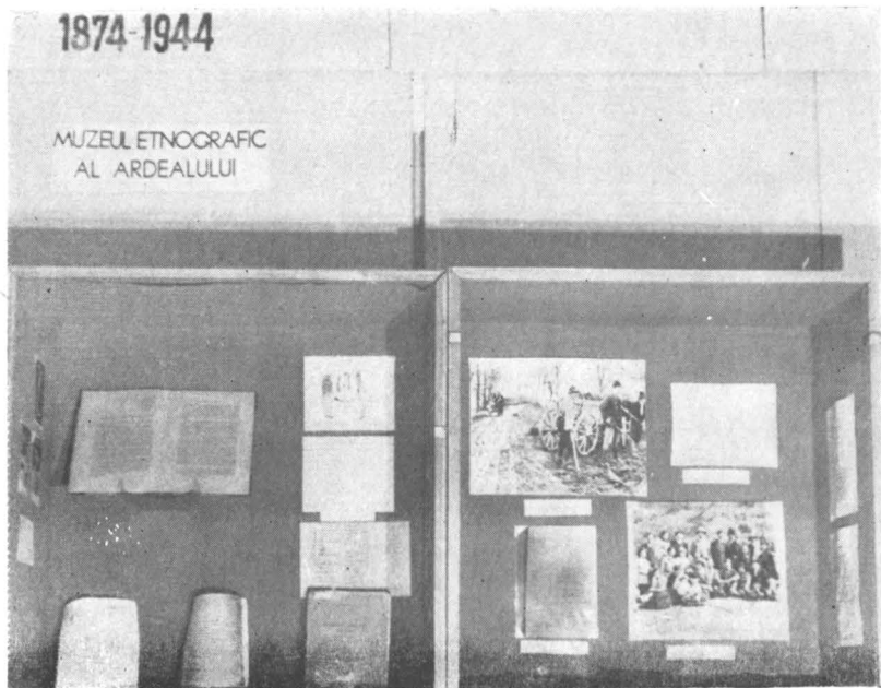
Aspect din expoziție

Muzeului de arheologie, istorie și etnografie din localitate.