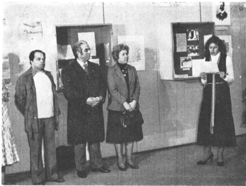
Moment de la vernisarea expoziției Din istoria muzeografiei etnografice românești

lor decorative, mergîndu-se pe o prezentare descriptivistă și analiza de astăzi a straturilor celor mai adînci pentru înțelegerea mecanismelor intime ce au guvernat actul creației artistice populare.