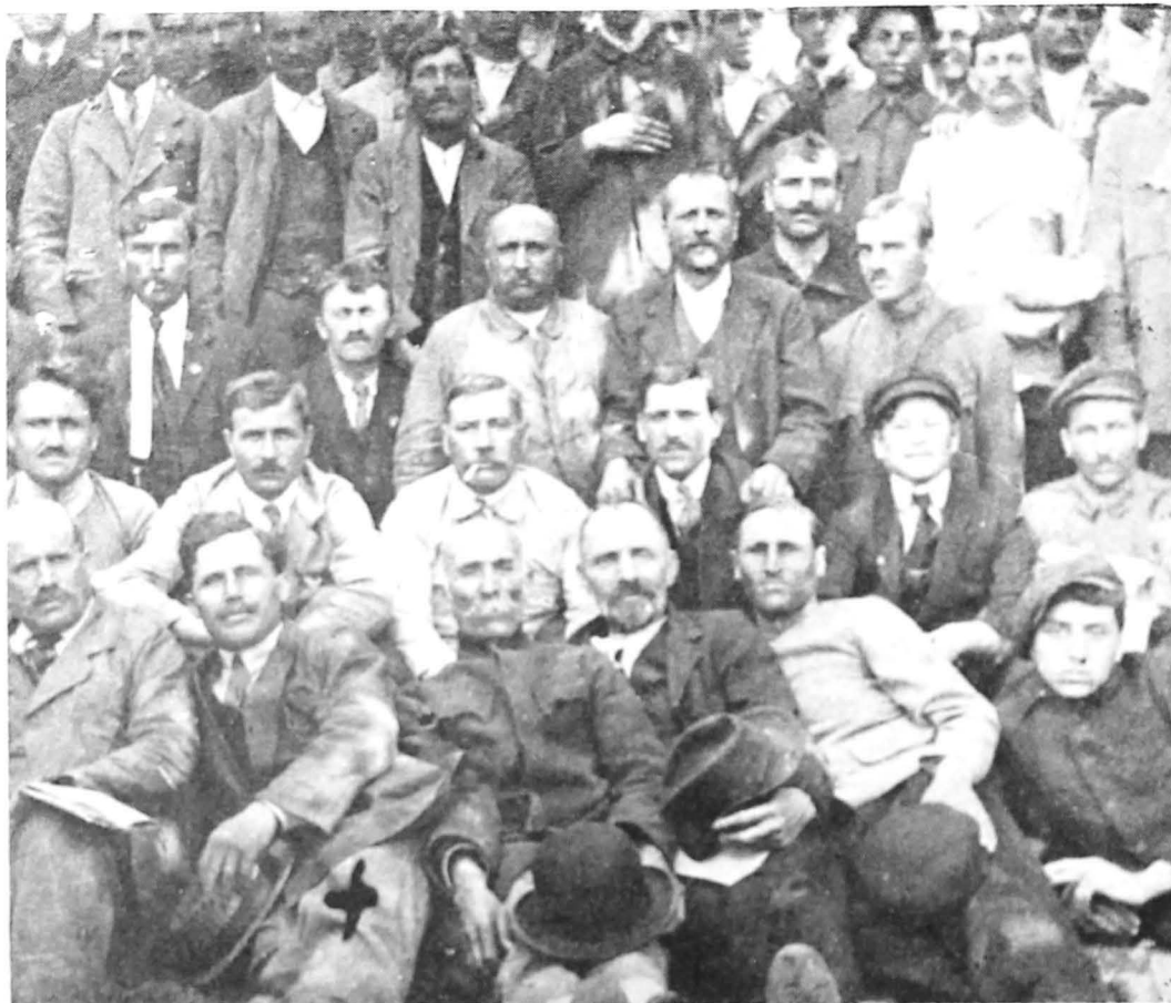
Muncitori participanți la greva generală din octombrie 1920

a adoptat programul comun al întregii mișcări socialiste din țară, punându-se astfel bazele unității ideologice ale acesteia.