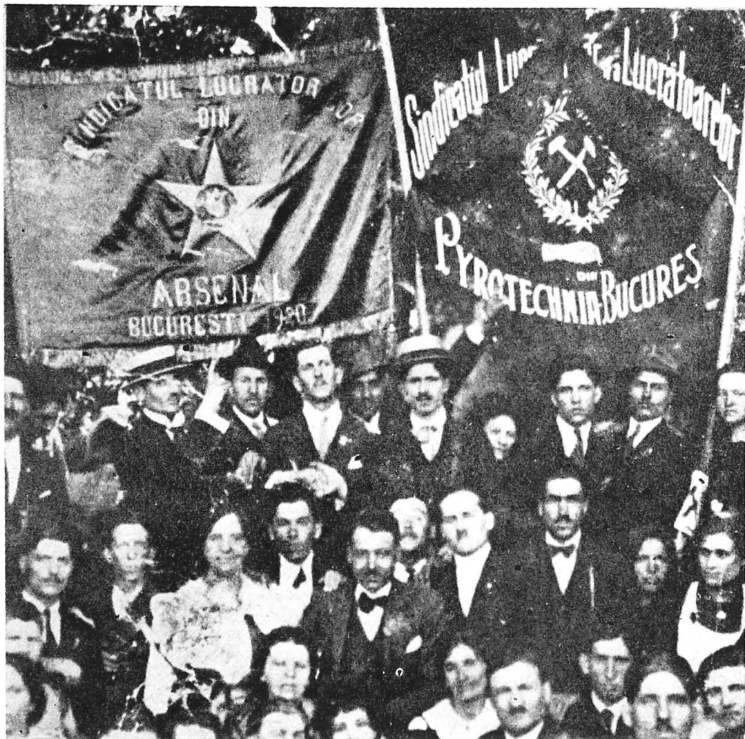
Muncitori din București sărbătorind ziua de 1 Mai 1920

Partidul Socialist devenise un partid de masă, reunind în 1920 peste 160 000 de membri, avînd la acea dată organizații în întreaga țară, detașîndu-se ca unul din cele mai mari partide din sud-estul Europei.