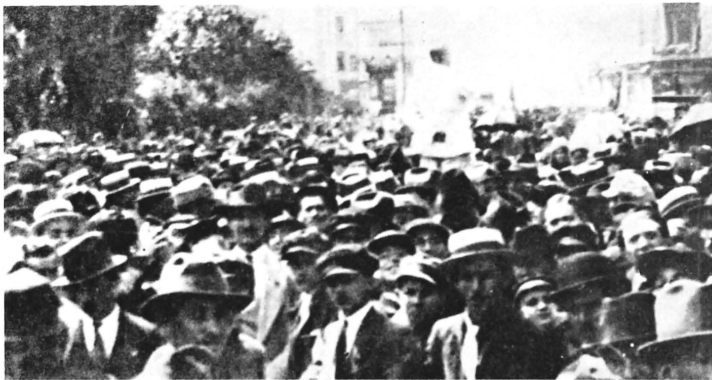
Demonstrația muncitorească de 1 Mai 1920 în București

prin revendicările înscrise în programul revoluționar de transformare radicală a orînduirii sociale, s-a manifestat ca forță de avangardă a societății românești. Experiența acumulată de clasa muncitoare în decursul deceniilor de luptă împotriva claselor exploataatoare, avîntul revoluționar de luptă al maselor au condus