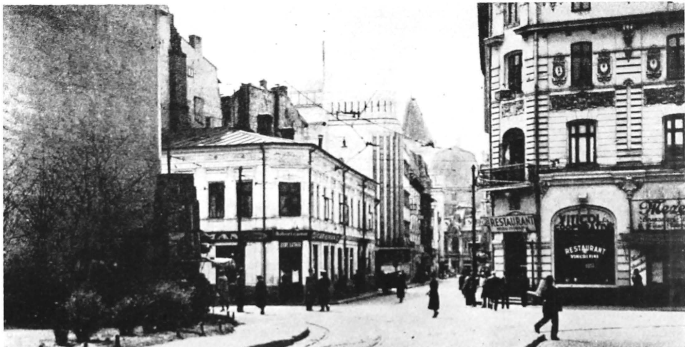
Strada Sfintu Ionică din București pe care s-a aflat clădirea unde își avea sediul Partidul Socialist și în care s-a desfășurat Congresul de făurire a Partidului Comunist Român, mai 1921

României. El și-a organizat forțele la scară națională, în timp ce celelalte partide nu atinseseră încă această cerință istorică, rămânând mai mult sau mai puțin doar partide regionale. În același timp, Partidul Comunist s-a manifestat ca un partid profund patriotic, național. Relevând semnificația istorică a congresului din mai 1921, care a statuat unificarea mișcării muncitorești pe temelii comuniste, secretarul general al partidului, tovarășul Nicolae Ceaușescu, subliniază că: „Formarea în 1921 a Partidului Comunist Român, detașament de avangardă al clasei muncitoare, a ridicat pe o treaptă nouă mișcarea revoluționară din România, a dezvoltat conștiința de clasă a maselor muncitoare, rolul lor în lupta pentru transformarea revoluționară a societății românești” 5 .