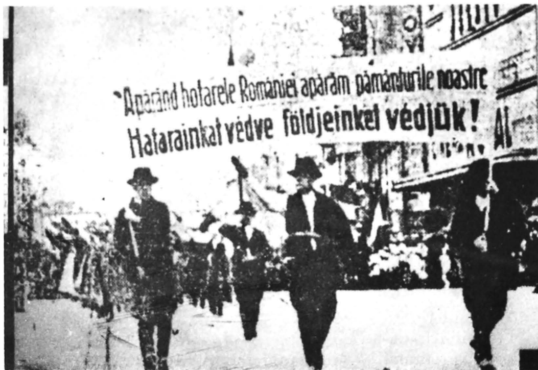
Manifestație organizată de Madosz împotriva acțiunilor statelor revizioniste, Cluj, 1939

Apreciind semnificația istorică a actului de la 23 August 1944, tovarășul Nicolae Ceaușescu, secretar general al Partidului Comunist Român, sublinia: „Declanșarea revoluției de eliberare socială