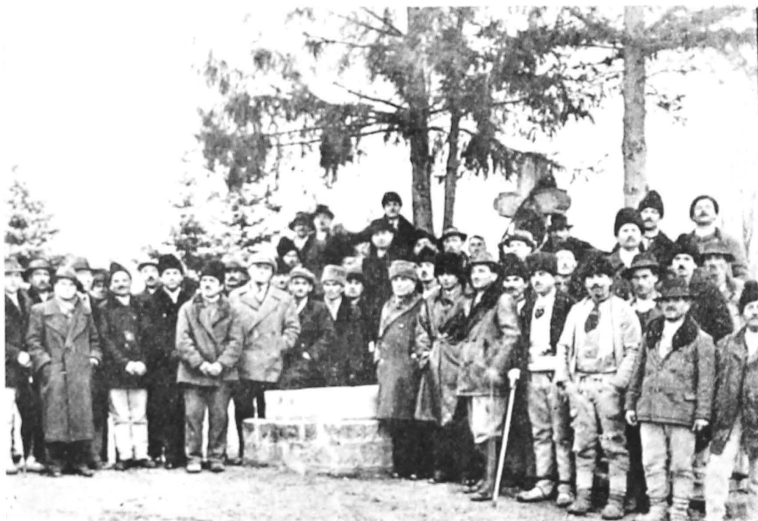
Participanți la semnarea acordului de front popular de la Tebea, 6 decembrie 1935

Analizînd pe larg activitatea partidului comunist, situația politică internă și internațională, poziția P.C.R. față de celelalte partide și grupări politice, starea