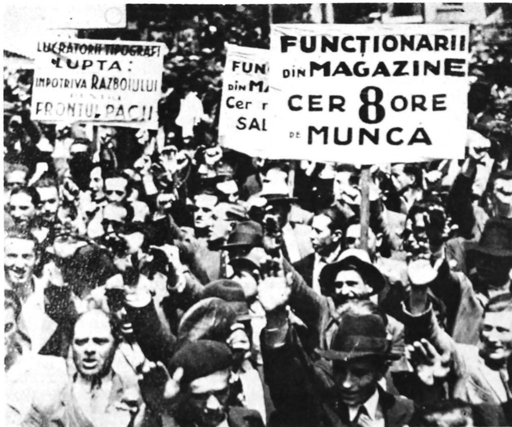
Aspect din timpul demonstrației antifasciste din București, 31 mai 1936

nia, interesate mai ales în salvarea țării de pericolul hitlerist. P.C.R. a făcut propuneri concrete conducerilor unor partide și grupări politice, în special Partidului Național-Țărănesc, pentru colaborarea în lupta împotriva fascismului și a războiului, propuneri urmate, într-o măsură tot mai largă, de rezultate practice. La 24 septembrie 1935, la Băcia, județul Hunedoara, se semnează un acord între Frontul Plugarilor și Madosz, iar la 26 noiembrie 1935, la București, un acord între Blocul Democratic și Partidul Socialist condus de C. Popovici. A urmat apoi, la 6 decembrie 1935, semnarea, la Țebea, județul Hunedoara, a acordului de front popular de către Blocul Democratic, Frontul Plugarilor, Partidul Socialist și Madosz.