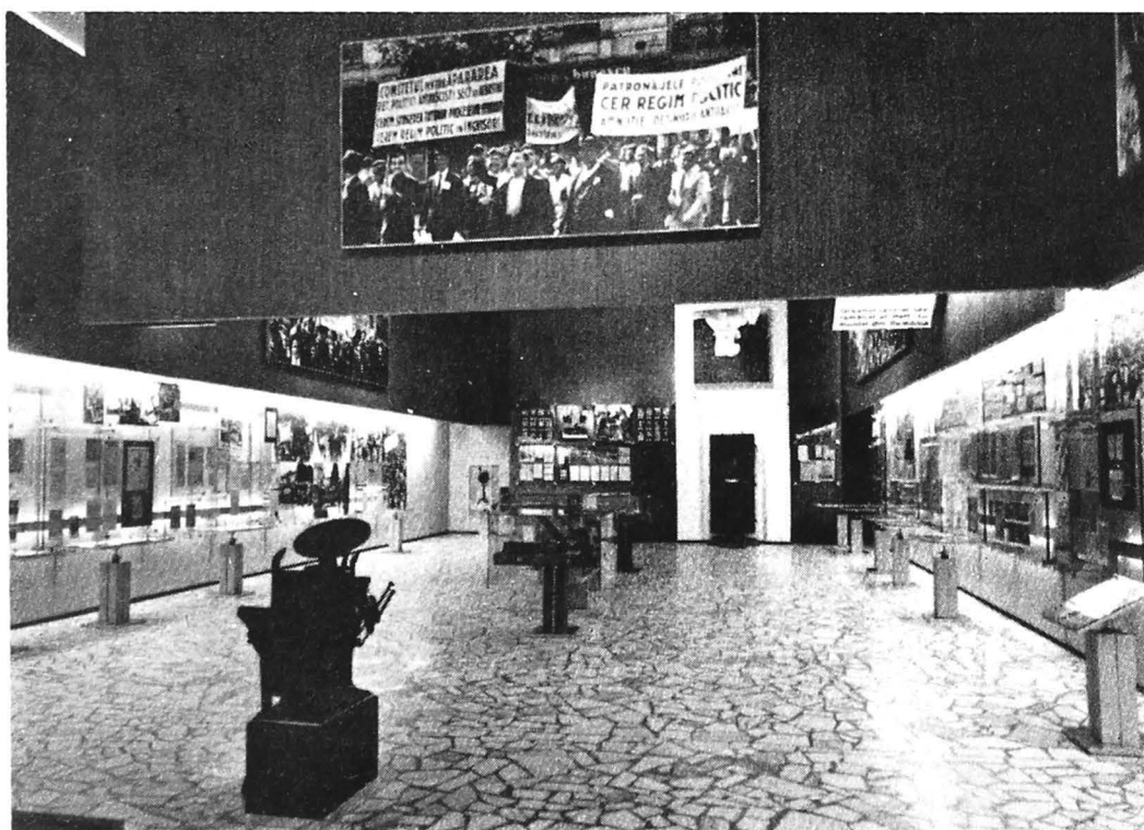
Muzeul de istorie a partidului comunist, a mișcării revoluționare și democratice din România. Aspect din sala în care este prezentată lupta antifascistă a poporului român în anii 1934—1940

Creșterea mișcării de rezistență a poporului român, loviturile zdrobitoare date armatei fasciste în anii 1942—1943 de către coaliția antifascistă, a cărei forță fundamentală a fost Uniunea Sovietică, au