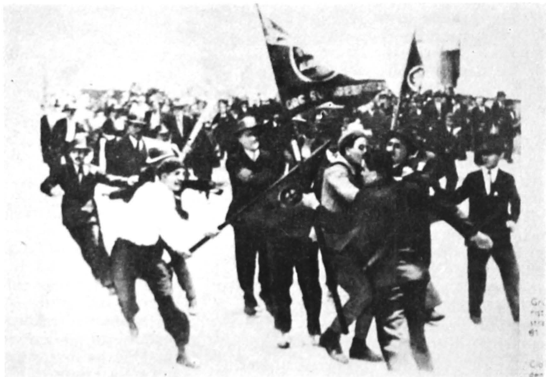
Aspect din timpul unei demonstrații antifasciste din București, 1936

program din 6 septembrie 1941, intitulată „ Lupta poporului român pentru libertate și independență națională ”, prin care P.C.R. a propus „ lupta comună a tuturor partidelor, grupărilor, persoanelor politice și tuturor patrioților români pentru realizarea FRONTULUI UNIC NAȚIONAL al poporului român contra ocupanților hitleriști și a slugilor lor trădătoare din țară ” 10 .