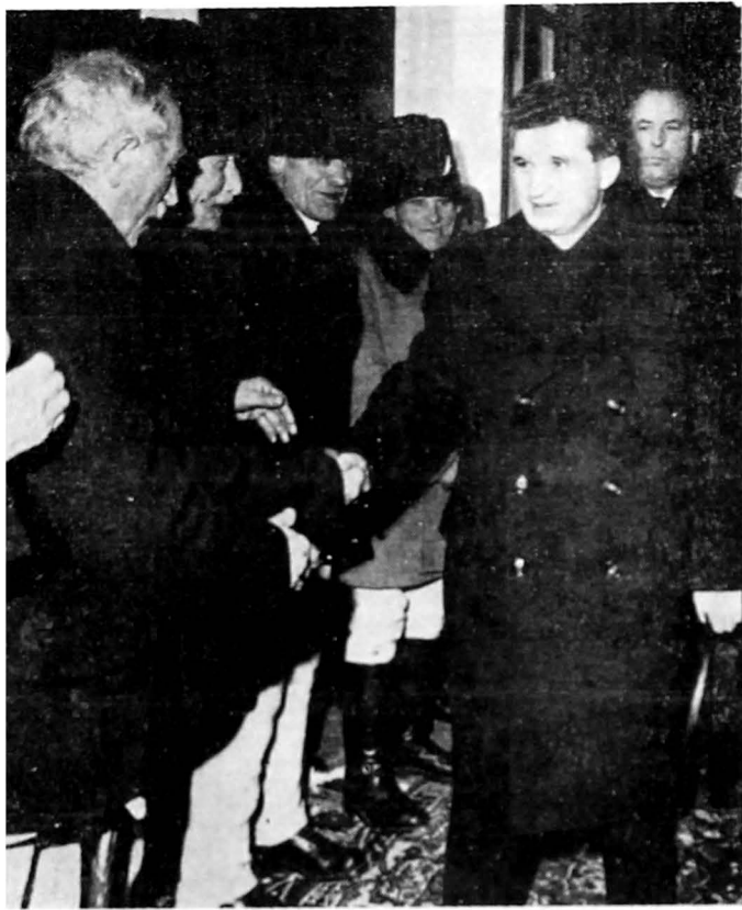
Președintele României Socialiste, tovarășul Nicolae Ceaușescu înconjurat cu dragoste și respect de veterani ai Marii Uniri de la 1 Decembrie 1918, cu prilejul vizitei efectuate la Alba Iulia în anul 1968

O hartă, planuri ale unor cetăți (Morești, jud. Mureș, sec. VI, X; Fundu Herții, jud. Botoșani, sec. VIII, X; Biharea, jud. Bihor, sec. X; Moldovenești, jud. Cluj, sec. XII), facsimile de pe documente ale vremii, inscripții, fotografii ale unor vase menționează diferite formațiuni statale românești din secolele VI—XIII; ca de exemplu, cele conduse de Gelu, Glad și Menumorut și lupta lor împotriva trupelor maghiare pătrunse în Transilvania, apoi cele conduse de Ioan, Farcaș, Litovoi și Seneslau. Toate demonstrează continuitatea daco-romană pe teritoriul României, permanența popoului român ca popor așezat, teritorializat, permanent prezent, legat de acest pământ, continuitatea organizării politice a locuitorilor acestor pământuri sub forma obștiilor și a uniunilor de obști. Alte mărturii reflectă organizarea, în cursul secolelor XIII—XIV, a statelor feudale românești — moment important în lupta popoului român pentru nea-tîrnare: voievodatul românesc al Tran-