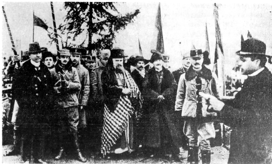
Aspect de la Marea Adunare Națională de la Alba Iulia, 1 Decembrie 1918

Țării Românești. „Victorie remarcabilă a maselor de țărani, meșteșugari, lucrători și țîrgoveți, a cărturarilor progresiști și patrioți, Unirea Principatelor — sublinia tovarășul Nicolae Ceaușescu — a reprezentat actul care a pus bazele statului național român modern. Ea a avut un puternic ecou și în Transilvania, întărind conștiința unității naționale a maselor populare din această provincie, stimulînd lupta lor pentru unire cu țara”.