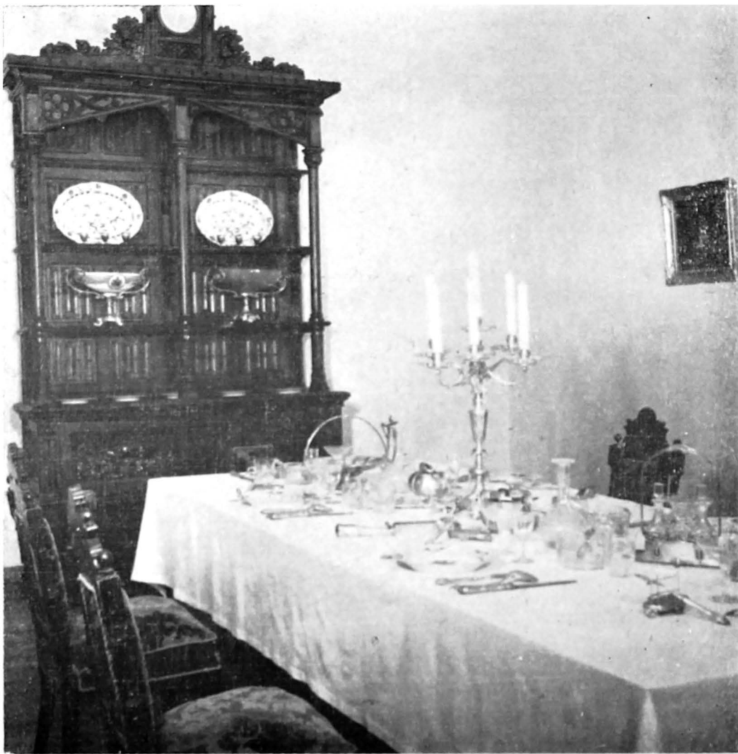
Reconstituirea sufrageriei din castelul domnesc de la Ruginoasa

tuite din citate extrase din cuvântările și scrierile luptătorilor revoluționari de la mijlocul secolului al XIX-lea din Moldova, Muntenia și Transilvania. Cum era și firesc, un loc aparte îl ocupă textele citate din discursurile, mesajele, proclamațiile și scrisorile lui Al. I. Cuza, texte de un ardent patriotism, surprinzând, cu clarviziune politică, perspectiva dezvoltării viitoare a României, fiind, totodată, texte de o rară frumusețe oratorică. Astfel, vizitatorii au posibilitatea documentării în ceea ce privește modul de gândire al conducătorului în momentele cheie ale istoriei Unirii. Un exemplu: o convingere de nestrămutat, care constituia o componentă de bază a structurii moral-politice a lui Al. I. Cuza, era plastic exprimată de însuși domnitorul prin mesajul său din 6 decembrie 1864: „ Eu am conștiința misiunii mele, care este de a funda statul și societatea română pe