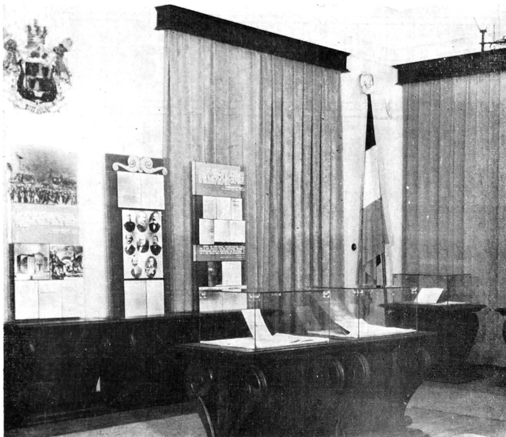
Aspect de la tema „Marile reforme, 1862—1866“

veacuri, al convingerii marelui patriot Al. I. Cuza în viitorul luminos al poporului și al pământului care la născut: „Eu vă declar că singura mea ambiție este de a păstra dragostea poporului român, este în adevăr de a fi folositor patriei mele, de a menține drepturile ei neatinse. Fie în capul țării, fie alături de dvs., eu voi fi totdeauna cu țara pentru țară, fără altă țintă decât voința națională și marile interese ale României”.