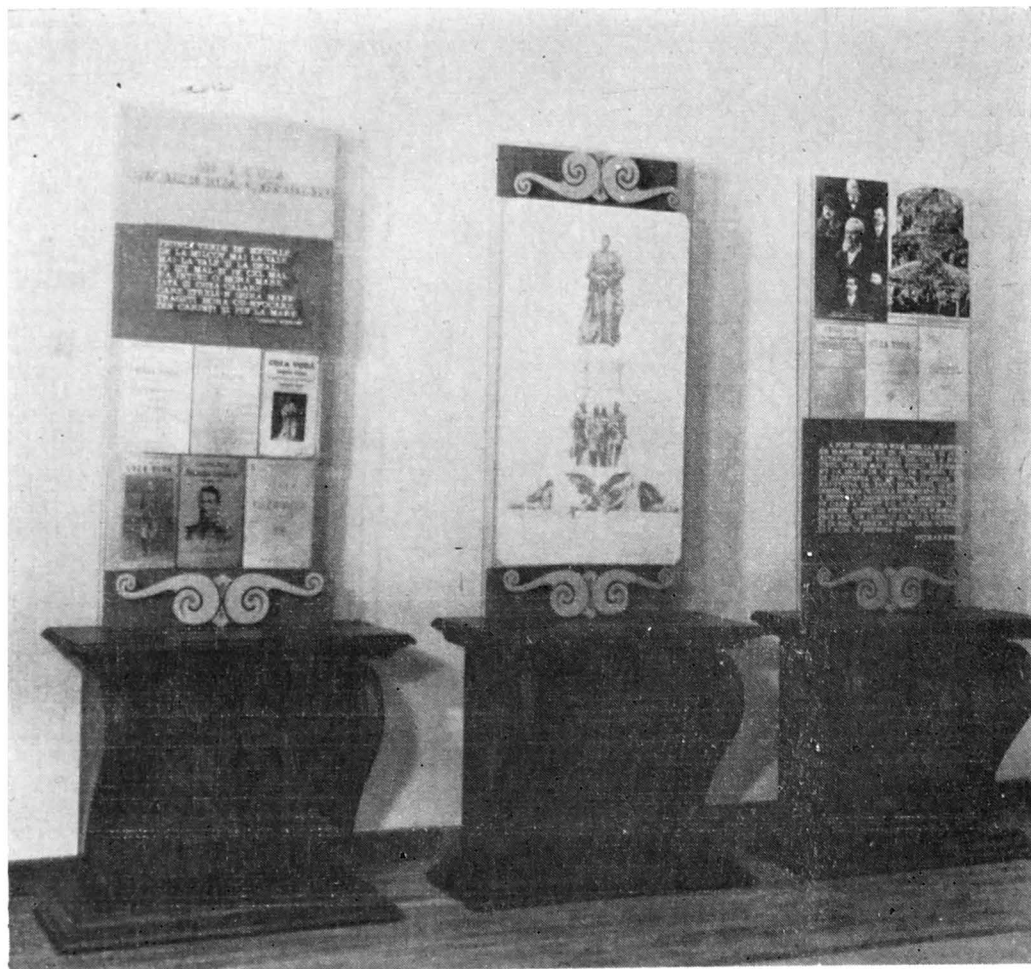
Al. I. Cuza în memoria posterității (documente)

omul care să lupte pentru împlinirea programului pașoptist („întruparea națiunii era el în gând și grai”, cum îl caracteriza Nicolae Iorga pe Al. I. Cuza) — totul deschizând larg drumul spre cucerirea independenței de stat în 1877, spre marea Unire din 1918.