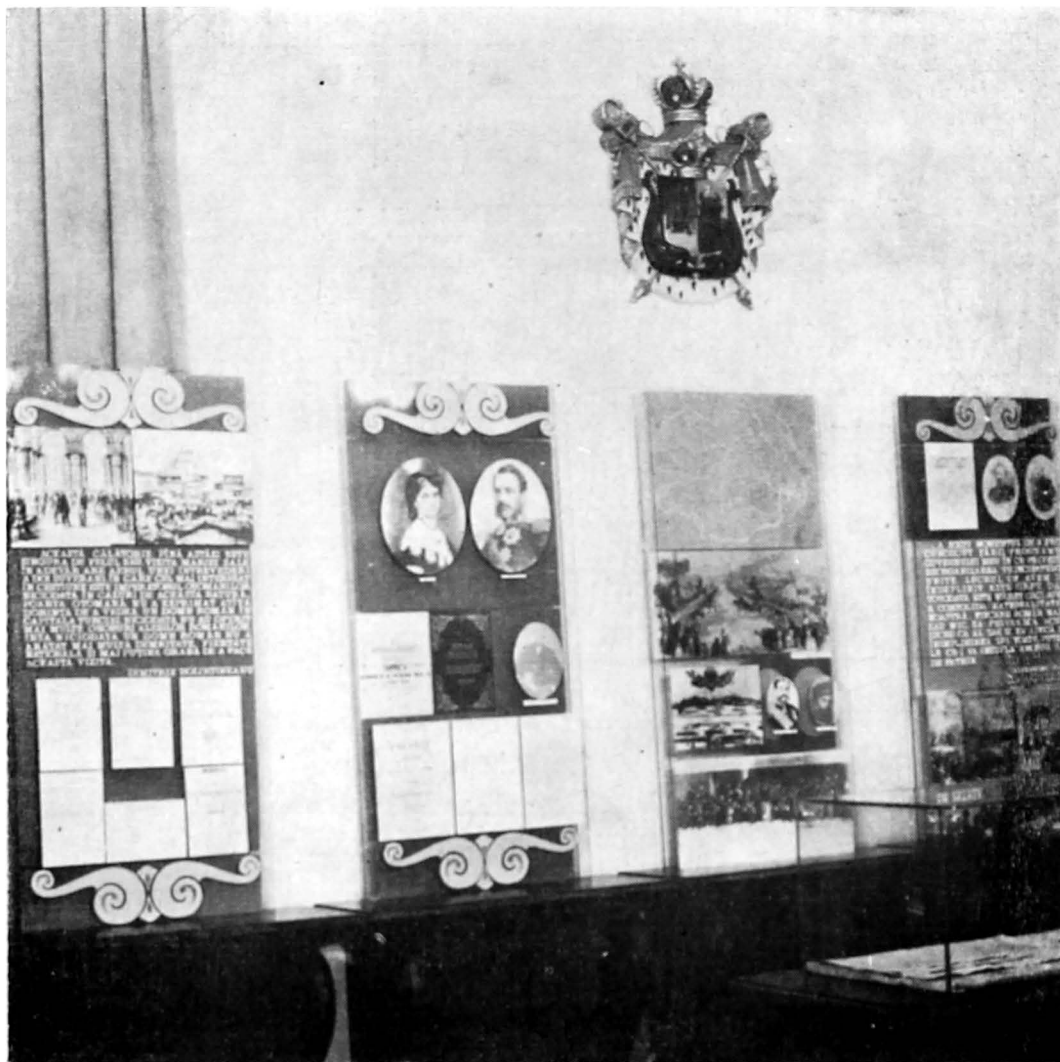
Aspect de la tema „Marile reforme, 1862 – 1866”

un șal de dantelă, albume cu fotografii, călimară, pană de scris, picturi de epocă etc. „vorbesc” în tăcere despre stăpîna lor de odinioară!