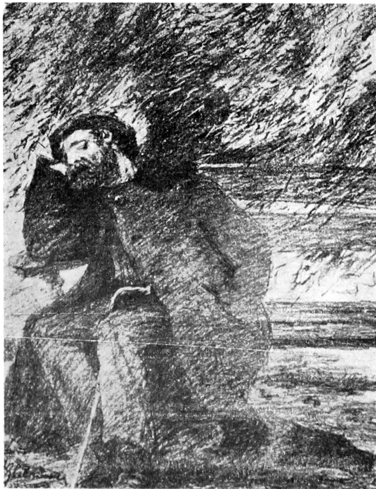
D. G. Lehman — Pe o bancă în parc

După 1900 însă, când își propune să devină colecționar de artă, Simu achiziționează, pe lângă pictură și sculptură, desene și gravuri din țară și din străinătate, devenind astfel unul dintre primii colecționari români care acordă atenție și lucrărilor de grafică. Interesant este faptul că Simu achiziționează desene și gravuri într-o vreme cînd majoritatea colecționarilor de atunci se opreau, cu precădere, la pictură, sculptură sau artă decorativă, considerînd lucrările de grafică de interes secundar. În felul