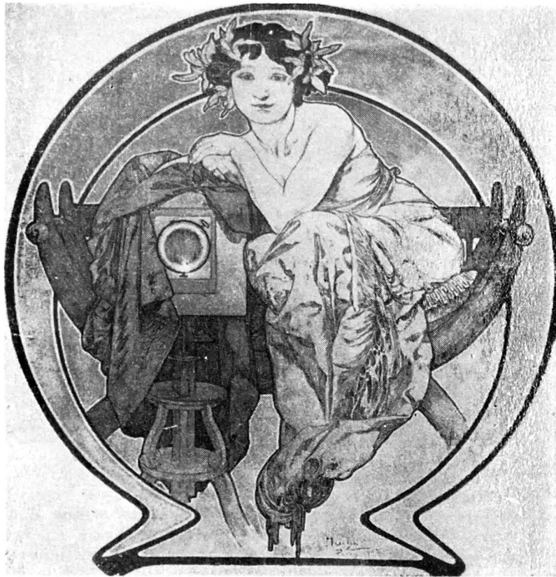
Alphonse Mucha— Alegorie