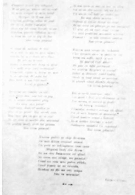
George Coșbuc, Noi vrem pământ

au avut-o atunci cînd au descoperit acest tezaur și l-au făcut cunoscut pe tot cuprinsul țării.