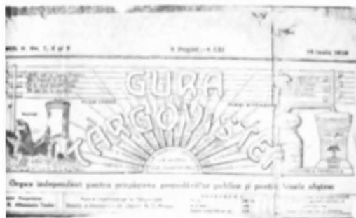
Frontispiciul gazetei tirgoviștene „Gura Tirgoviștei”

cei de pe Ialomîța de jos călăresc minunat: e greu să-i ajungi — au și loc larg de alergătură. Fiecare regiune are deosebită aplecare; și după loc, deosebite apucături s-au dezvoltat. În genere, românii sunt bravi și sobri, răbdători și cuminiți; pricep ușor; sunt spirituali și vorbesc o limbă foarte colorată și elegantă” 36 . Însușindu-și aceste sensuri, un hebdomadar local din perioada iunie 1928 — august 1934, avînd pe frontispiciu și o alegorie legată de O scrisoare pierdută , se numea simbolic „Gura Tirgoviștei”.