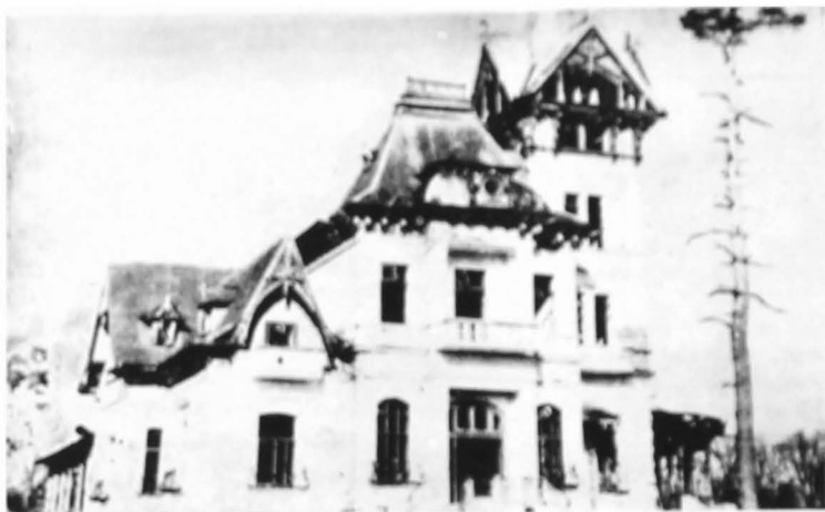
Vila „Mierca” din pădurea Priseaca, vizitată de scriitor