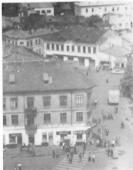
Tirgoviștea la sfârșitul secolului al XIX-lea (în stînga, sus, hanul „Europa”)

mente” aici, făcînd „o ultimă încercare de a pune geneza intrigii dramatice din capodopera caragiăliană sub egida documentului uman copiat după cronică scandaloaasă a provinciei” 9 .