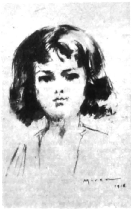
George Demetrescu-Mirea, Cap de copil , 1918

În februarie 1907, viața artistică a Bucureștiului cunoaște un moment de excepție: vizita compozitorului italian Pietro Mascagni, care, după premiera mondială a operei sale Cavaleria rusticana , la 17 mai 1890, pe scena teatrului „Costanzi” din Roma 19 , dobândise o celebritate la fel de mare ca aceea a lui Rossini sau Verdi. Iubitorii de operă din România făcuseră cunoștință cu Cavaleria rusticana încă din aprilie 1891 20 , când creația tinărului compozitor livornez, socotit de critica mondială succesorul legitim al tradițiilor muzicii lirice italiene și, în același timp, reformatorul ei, a fost prezentată la București, cu Hariclea Darclee în rolul Santuzzei. Cele două concerte, susținute, pe 11 și respectiv 14 februarie 1907 21 , de orchestra Ministerului Instrucțiunii Publice, sub bagheta maestrului italian, au avut „un succes triumfal”, ele incluzând în program, pe lângă uvertura din Tanhäuser de Richard Wagner, fragmente din chiar compozițiile lui Mascagni, Amico Fritz și Gavotta delle bambole , și, firește, cunoscutul intermezzo al Cavaleriei rustice . Așa cum