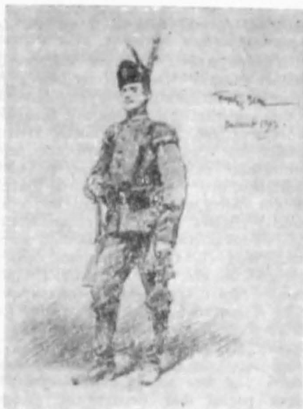
Geophres — Scott, Dorobanț , 1919

În toate serile ... e plină de toată aristocrația bucureșteană și altă lume ce se acață de lumea înaltă. Se spunea — și așa era — că au fost jemei care și-au ipotecat casele ca să-și poată cumpăra diamante, toalete și plăți loja în care să figureze la celebrele reprezentațiuni” 32 .