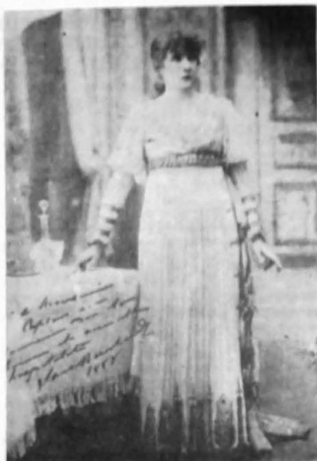
Fotografie a actriței franceze Sarah Bernhardt purtînd și dedicația autografă pentru proprietarul Casei „Capșa”

După moartea lui Grigore Capșa, survinută în 1902, Casa „Capșa” este condusă timp de mai mulți ani de Ștefan, fiul lui Constantin, singurul dintre copiii fraților Capșa care a îmbrățișat meseria de cofetar. După o îndelungată și fructuoasă coexistență alături de hotel și restaurant, în 1938 14 , cafeneaua, care, după desființarea Terasei Oteteleșeanu, pe locul căreia s-a construit Palatul Telefoanelor, „devenise locul de întîlnire al poezilor și literaților”, este suprimată pentru mărirea spațiului destinat restau-