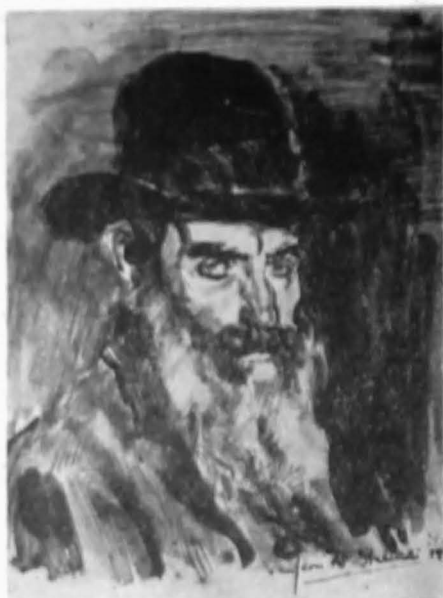
Jean Alexandru Steriadi, Portret de bărbat , 1919

a fost primit de colonia italiană și de mulți admiratori ai săi. S-au dat serate și prinzuri în onoarea sa” 22 . Cu siguranță unul din prinzuri va fi avut loc în saloanele restaurantului Capșa, imediat după primul concert, pentru că în Cartea de impresii de care ne ocupăm este consemnată prezența lui Mascagni acolo prin câteva măsuri muzicale din intermezzoul Cavaleriei rustice , semnate de compozitor și datate „București, 11/24 februarie 1907” 23 .