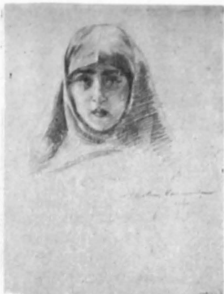
Nicolae Vermont, Soră de caritate , 1920

În noiembrie 1904, Sarah Bernhardt, „unica artistă europeană, adevărată celebră” 33 , este din nou așteptată în București, unde sosește însoțită de întreaga trupă (40 persoane) a teatrului ce-i purta numele și de „trei vagoane de decoruri și costume proprii”. Reprezentațiile au loc în sala Teatrului Liric între 8 și 15 noiembrie 1904, din repertoriu făcând parte La Sorciere (Vrăjitoarea), Fedora și La Tosca de Sardou, L’Aiglon (Vulturășul) de Edmond Rostand, în care interpretează, în travesti, rolul duceului de Reichstadt și Dama cu camelii a lui Dumas-fiul 34 . Ziarele anunțau că „cea mai mare tragediciană a Franței ... vine... pentru ultima oară în București” 35 , deci acest turneu din 1904 ar putea fi socotit turneu său de adio din România. Se va fi întâmplat însă ca în cazul „turneului american de adio al lui Madame Sarah Bernhardt” 36 din 1905 — 1906,