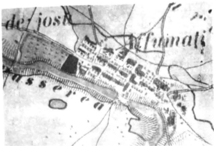
Satul Afumați, jud. Ilfov, după Harta Flügely — România Meridională de la anul 1858 — 1864; (așezare întemeiată pe studii și proiecte inginerești ridicate în perioada reglementară)

firelor de apă etc. Numai războaiele ruso-turco-austriece atât de numeroase în acest secol au dus la modificarea structurii lor tradiționale, un fapt căruia i s-a adăugat și creșterea firească a populației. Locuitorii și-au făcut „sate întregi cu o mulțime de vite la poalele dealurilor de vi” 2 .