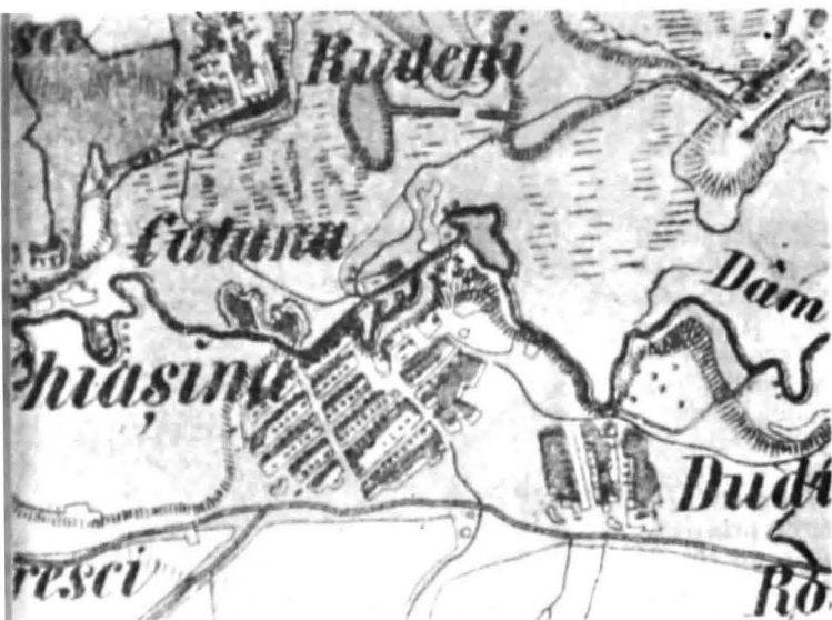
Satul Chiajna, jud. Ilfov, după harta de la 1838 – 1864; (așezare ordonată după studii și proiecte inginerești ridicate în perioada regulamentară)

șune cu stinele și odăile lor, marginea bălților sau firul apelor, intersecția drumurilor, existența unui iaz sau a unei mori de apă, o stație de poștă, un han sau o circiumă, o ctitorie sau o curte boierească etc.