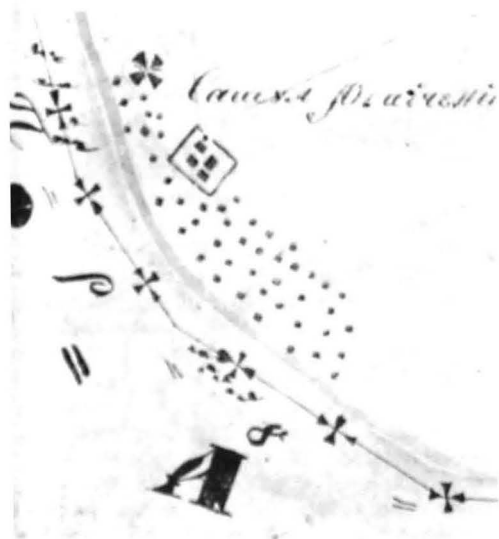
Satul Râpicești, jud. Botoșani, după un plan de hotărnicie din perioada regulamentară (așezare întinsă de-a lungul firului apei, incluzând în compoziția sa biserica, școala satească, casa de sfat și alte dotări comunale)

rilor satești a fost regimul juriic: cu dreptul de proprietate asupra moșiei. Ne este bine cunoscută situația satelor de moșneni, preponderente în zonele submontane și de deal, precum și a satelor de clăcași de pe moșiile boierești și cele ale mănăstirilor, dominante la cîmpie. Deosebiri între așezările de acest fel au rezultat din faptul că în satele de moșneni, aflindu-se pe moșiile lor, sâtenii își amplasau gospodăriile așa cum le convenea, urmărind tendința de răsfire, cum o dicta cadrul local.