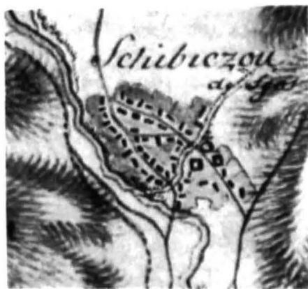
Satul Sibiciu, jud. Buzău, după harta de la 1791-1792; (așezare de tip adunat dezvoltată în jurul a două curți boierești și a unei biserici parohiale alăturate situată pe un bot de deal; înscrisura și adaptarea la teren se resimțesc a fi proprie studenților și proiectelor ingineresti anume elaborate)

Privind retrospectiv procesul de dezvoltare a așezărilor satești, se poate desprinde ideea că de fapt fiecare etapă a statornicit reguli de definitivare a fizionomiei așezărilor realizabile în cuprinsul a 50-60 de ani, după care vedem că totul urmează să fie reluat, conform realităților intervenite. Cutremurele, inundațiile ca și alte măsuri de ordin administrativ au fost factori de di-