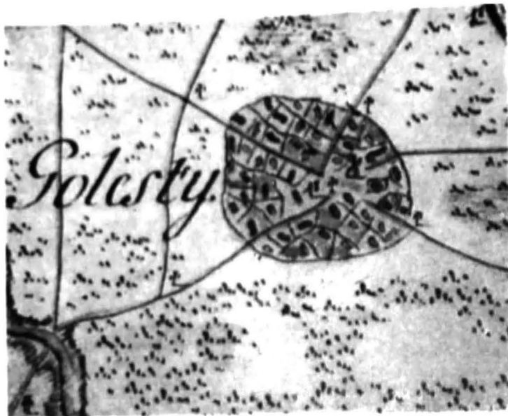
Satul Golești, jud. Argeș după harta de la 1791-1792; (așezare de tip adunat, dezvoltată pe intersecția drumurilor locale, în jurul unei curți boierești, a bisericii parohiale și a unei întini)

tarea față de dominantele reliefului (cu importanța lor economică sau de alt ordin) și rețeaua de legătură cu vecinătățile. Nici așezările cu caracter temporar, nici așezările specializate într-un domeniu sau altul nu fac excepție.