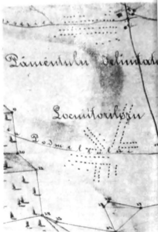
Satele Podmeltul și Valea Bisericii din jud. Dolj; (schită indicativă după un plan de hotărnicie din perioada post regulamentară)

Principiul acesta de ordonare a vetrelor de sat și-a dovedit viabilitatea pînă către mijlocul secolului, cînd apar o serie de reglementări noi în privința organizării localităților, a alinierii satelor, întemeiate pe alte criterii; între timp își făcuseră loc preocupări ca așezările satești să se alcătuiască după proiecte tehnice, cu rezolvări proprii, în suita cărora s-au înscris compoziții dezvoltate liniar, înfățișînd tronsoane drepte, intersecții simple