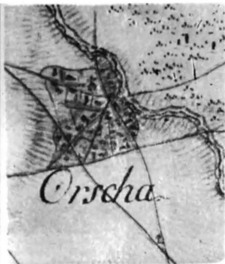
Satul Oarja, jud. Argeș, după harta teritoriului ridicată de căpitanul Specht la 1791—1792; (așezare de tip alunat situată pe intersecția drumurilor locale la marginea riului, avînd în centrul sîntutitoria sîtească)

Harta moșiilor Lieștii și Bătrîneștii din ținutul Tutovei (1769—1786) oferă cum nu se poate mai bine modul de înțelegere, dintotdeauna, a stăpînirii moșiei, de organizare a vetrelor sîtești și amenajarea cursurilor: Siretul, se arată aici, amenajat cu malurile urmate de o rețea întregă de bălți pentru pescuit și numeroase mori, fiecare cu heleșteul ei zăgăzuit pe văile afluenților; podurile plutitoare asigurau mersul în lungul apei și trecerea de pe un mal pe altul. Alte elemente privesc redarea structurii reliefului, locurile de pășune și plantațiile, înșiruirea caselor cu tipurile de locuință, ctitoriile sîtești cu arhitectura lor etc. 1