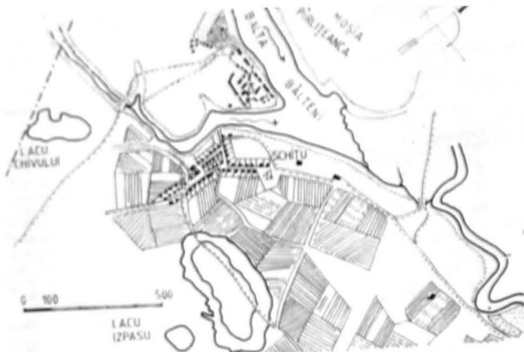
Satul Schitu de pe moșia Tîgănești din jud. Ilfov; detaliu din planul de hotărnicie din anul 1836, de inginer Carol Gold