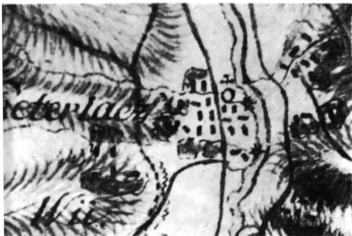
Satul Pătirlagele, jud. Buzău, după harta de la 1791 - 1792; (așezare de tip dezvoltat situată pe malul apei Buzăului la intersecția drumurilor locale, care include în compoziția sa biserica satească și cele două mori de apă)