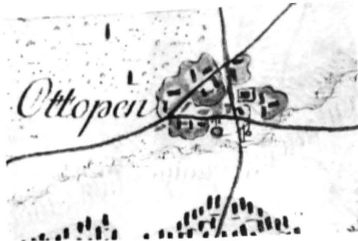
Satul Otopeni, jud. Ilfov după harta de la 1791—1792; (așezare situată pe intersecția drumurilor locale, în jurul unei curți boierești, a bisericii și a unei fântini publice).