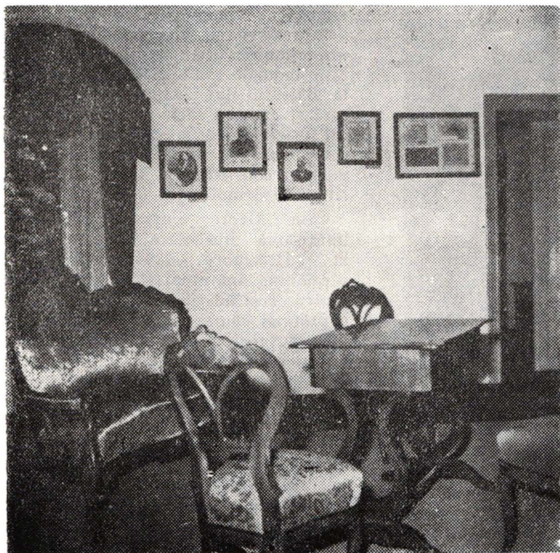
Aspect din interiorul casei de la Băsești

documentelor, rame și draperii bogate, completind funcțional și estetic interioarele casei.