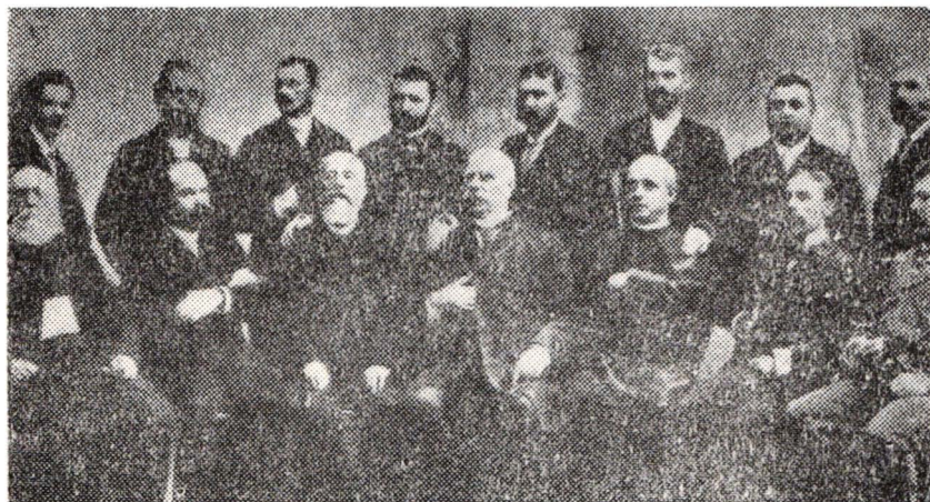
Conducătorii Partidului Național Român din Transilvania. În plan central, George Pop de Băsești, dr. Ioan Rațiu, dr. Vasile Lucaciu.

august 1940, în preajma tragediei cedării Ardealului de nord Ungariei.