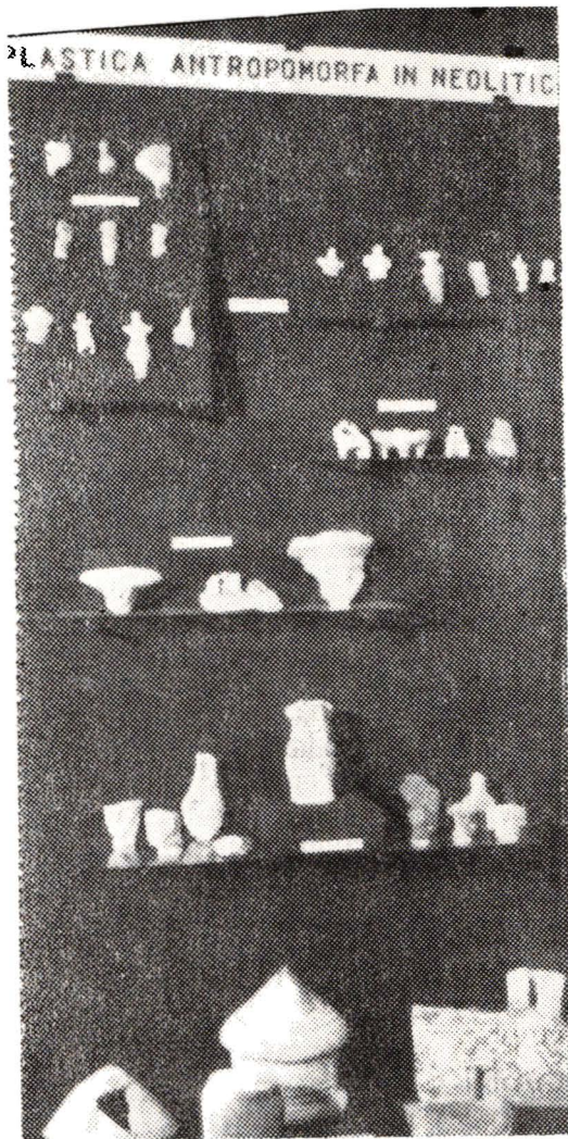
Mărturii arheologice din epoca romană

al doilea tip pentru obiecte mai mici, documente, facsimile, presă. La postament ambele tipuri au lăzi de depozitare. Vitrinele, totuși, nu asigură etarșizarea perfectă la praf. În ceea ce privește iluminatul, clădirea a fost prevăzută cu instalație electrică atât pentru vitrine cât și pentru iluminatul general cu tuburi fluorescente.