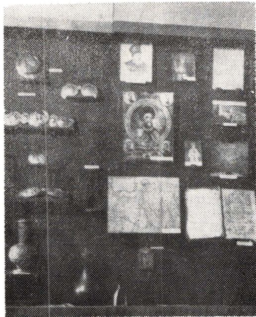
Obiecte din secolele XVI—XVIII

Viața politică românească din secolele XIV—XVIII se desfășoară între aceleași țeluri comune, de unitate și luptă pentru independență statală. Sunt prezentați principalii eroi români ai luptei antiotomane: Mircea cel Bătrîn, Vlad Țepeș, Mihai Viteazul și Constantin Brâncoveanu. Ca un moment important al luptei poporului român pentru independență și unitate este prezentat rolul istoric al inimosului domnitor Mihai Viteazul, făptuitorul unirii politice a țărilor române în anul 1600. Avînd în vedere că la Caracal exista o curte domnească unde Mihai Viteazul a construit și o biserică, am scos în prim plan ruinele curții domnești, biserica domnească, precum și un facsimil după hrisovul emis la Tirgoviște, în care sunt menționate proprietățile lui Mihai Viteazul în Romanati, datat la 6 septembrie 1598. De asemenea, sunt expuse obiecte de epocă — cercei, brățări,