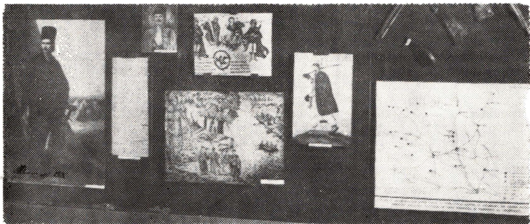
Anul revoluționar 1821 în Romanați

nia, Transilvania și Prusia. În continuare sunt etalate obiecte de podoabă din bronz și argint (paftale), vase de uz casnic din secolul al XVIII-lea, o evanghelie imprimată la tipografia Râmnicului în anul 1746, o icoană pe lemn din secolul al XVIII-lea, harta Valahiei, întocmită de stolnicul Constantin Cantacuzino în anul 1718, unde este menționată reședința Romanațiului.