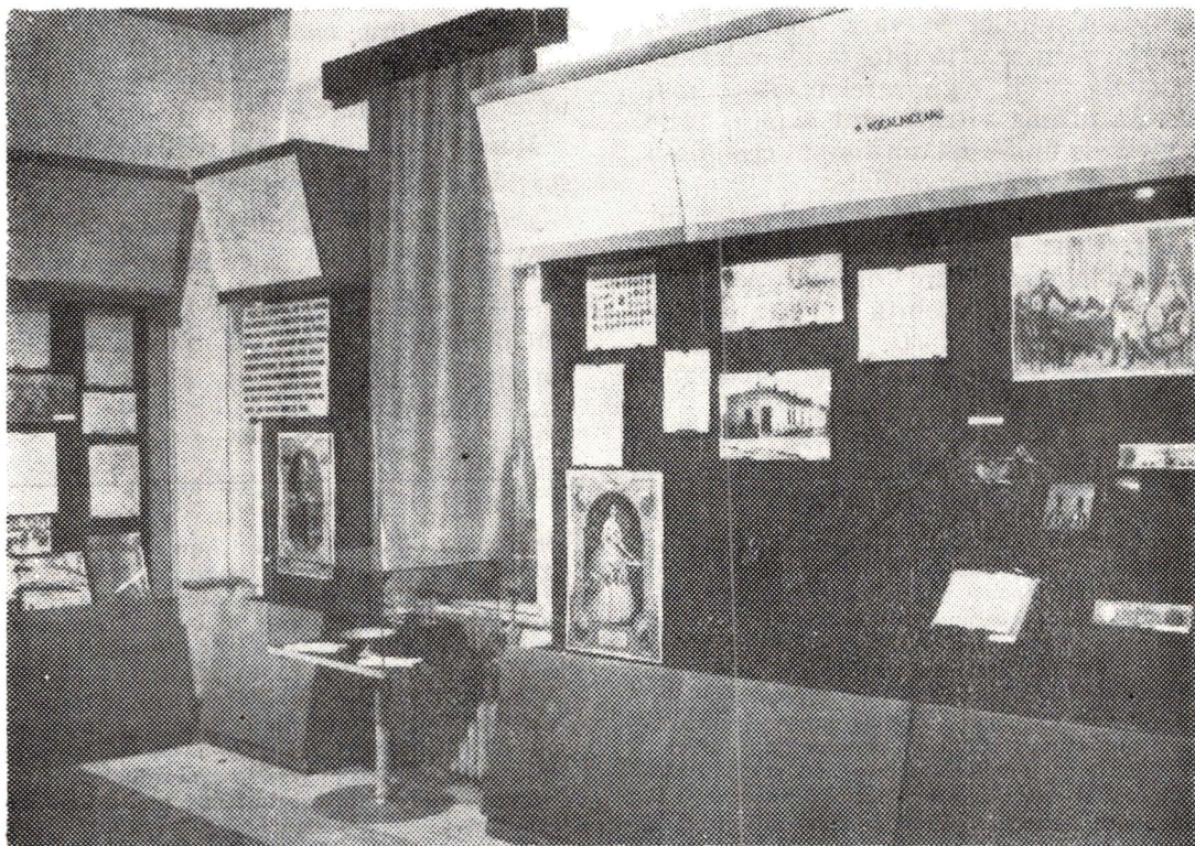
Aspect din sala unirii Principatelor Române

După realizarea Marii Unirii, un obiectiv politic și economic deosebit de important l-a constituit consolidarea statului național unitar român. S-au elaborat legi ce au oferit un cadru unitar dezvoltării economiei, vieții politice și culturale, precum și organizării administrative. De asemenea, s-a elaborat o nouă Constituție ce prevedea drepturi și libertăți democratice. Toate acestea, precum și as-