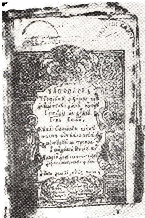
Ceasoslov. Iași, 1777. Foaie de titlu

de'nțeles (1681), Parimiile (1683) și celebra Psaltire în versuri imprimată, în 1673, la Kiev, alături de un exemplar cu foaia de titlu reparată de Gheorghe Asachi. Prezența, între altele, a Evangheliei bucureștene din 1682, prima evangheligie tipărită în limba română, a Evangheliei greco-romane din 1693 , a Evangheliei imprimate la Snagov, în 1697, prilejuiesc evocarea numelui lui Antim Ivireanul, marele tipograf al domnitorului Constantin Brâncoveanu, întemeietorul tiparnițelor de la București, Snagov, Râmnic. Dimitrie Cantemir este prezent în expoziție cu un exemplar din Divanul sau gâlceava înțeleptului cu lumea , Iași, 1698 și Descrierea Moldovei , în prima traducere românească, datorată tipografiei de la mănăstirea Neamț (1825).