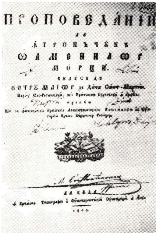
Petru Maior, Propovedanii la îngropăciunea camicilor morți . Buda, 1908, Foaie de titlu.

Atenția cuvenită a fost acordată legăturii de epocă, prin expunerea citorva cărți cu ferecătură, și aspectului grafic, a realizării ilustrației de carte, prin fotografiile și xilografuri.