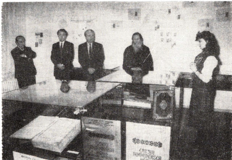
Aspect de la deschiderea expoziției