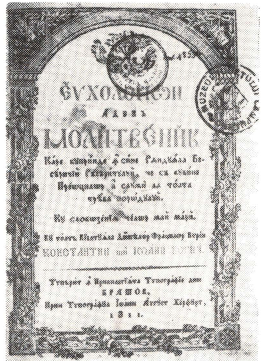
Molitvenic , Brașov, 1811, Foaia de titlu.

cizăm că Liturghia tipărită la Rădăuți, în 1745, a fost cel dintâi Liturghier românesc tipărit în Moldova, că tipografia rădăuțeană deși a funcționat atit de puțin, între anii 1744—1746, s-a considerat a fi o ripostă la tendințele de grecizare în Moldova și, în același timp, un factor de întărire a ortodoxismului din Transilvania, fapt dovedit de multele exemplare ce au circulat în această zonă. Una din cărțile de referință ale posibilităților editoriale ale Blajului este Biblia din 1795. Din creațiile tipografice ale Vienei, colecțiile județului Suceava păstrează multe manuale școlare, unele prezente în expoziție: Carte trebuincioasă pentru dascăli (1785). Multele titluri apărute în tipografia Universității din Buda se exemplifică cu o parte din operele scriitorului ardelean iluminist Petru Maior: Istoria pentru începutul românilor în Dachia (1812), Prediche (1810—1811) ș.a. Bine reprezentată este activitatea prolifică a editorului tipograf Mihail Strelbițki, a cărui tipografie a funcționat la Iași, Dubăsari și Movilău, peste Nistru. Tipografia de la Neamț este reprezentată, între altele, de celebra Evanghelie din 1821, realizare tipografică de excepție, în primul rind, prin ilustrația foarte bogată a fiecărei pagini.