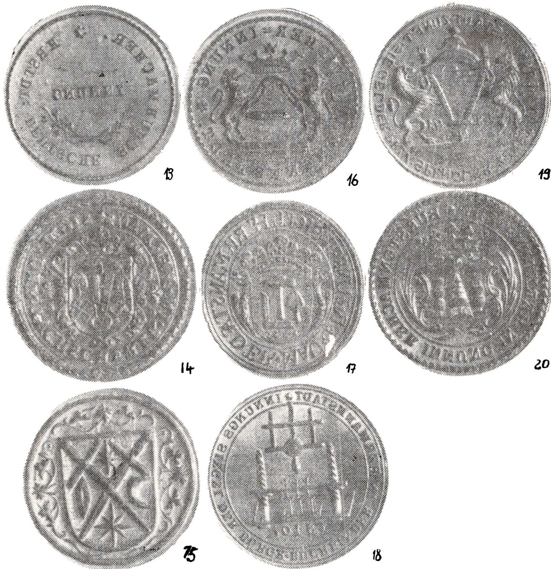
Tipare sigilare ale breslelor din Sibiu (p. 64—65): fig. 1. rotarilor (1709); fig. 2. rotarilor (1813); fig. 3. arămarilor (1712); fig. 4. potcovarilor și fierarilor (1716); fig. 5. timplarilor (1720); fig. 6. tricoterilor de ciorapi (1724); fig. 7. curelarilor (1768); fig. 8. strungarilor (1785); fig. 9. dogarilor (1788); fig. 10. cizmarilor (sec. XVIII); fig. 11. croitorilor germani din Sibiu (sec. XVIII); fig. 12. pantofarilor germani din Sibiu (sec. XVIII); fig. 13. pantofarilor germani din Sibiu (sec. XIX); fig. 14. tunzătorilor de postav (sec. XVIII); fig. 15. țesătorilor (sec. XVIII); fig. 16. țesătorilor (sec. XIX); fig. 17. zidarilor (sec. XVIII); fig. 18. legătorilor de cărți (1840); fig. 19. tinchigiilor (1841); fig. 20. perierilor (sec. XIX)