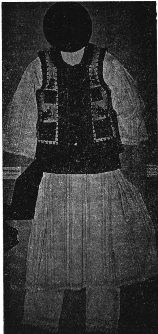
Costum bărbătesc de sărbătoare — Curtișoara, Olt

Pe aproape toată întinderea spațiului cultural românesc, mirele — spre a se distinge de restul nuntașilor — trebuia să respecte anume reguli ceremoniale, potrivit rânduielii transmise din generație în generație, colectivitatea tradi-