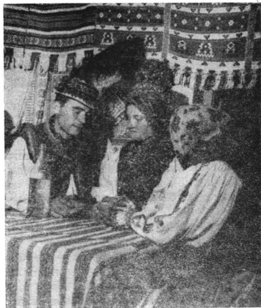
Miri din Maramureș