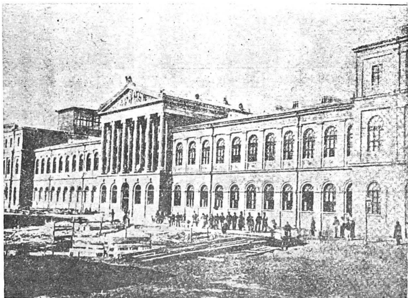
Clădirea Universității din București în 1863.

Ieșirile pe teren, în țară, ale lui C. Ferreratti îmbogățeau periodic colecțiile cu noi piese zoologice 6 dar naturalistul italian a dăruit Muzeului și numeroase piese exotice obținute în cursul călătoriilor sale în străinătate. S-ar putea să fi