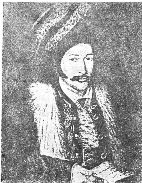
Carol Wallenstein (1795—1863), autoportret

Două evenimente de importanță culturală se cuvin, de asemenea, menționate. Apariția, la 5 februarie 1836, a primului număr din „Muzeul Național”, gazetă literară și industrială, supliment al ziarului lui Heliade Rădulescu, „Curierul Românesc”, care publicase, în numărul 58, din 13 decembrie 1834, prima știre despre înființarea Muzeului și reprodusese atât Proiectul lui Mihalache Ghica cât și decretul lui Alexandru Dimitrie Ghica. 1 Alegerea titlului ne apare ca o dovadă a interesului stârnit de noua instituție, paginile gazetei adăpostind informații privind activitatea și evolu-