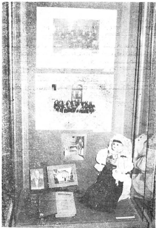
Exponate reflectând activitatea ASTREI

Expoziția începe cu prezentarea orașului Sibiu în diferite perioade: secolele al XIII-lea și al XVI-lea (planul Sibiului din acea perioadă), planul orașului în 1699, sfârșitul secolului al XIX-lea