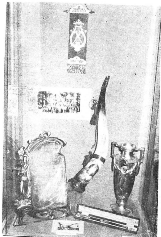
Piese referitoare la Asociația de muzică „Hermania”