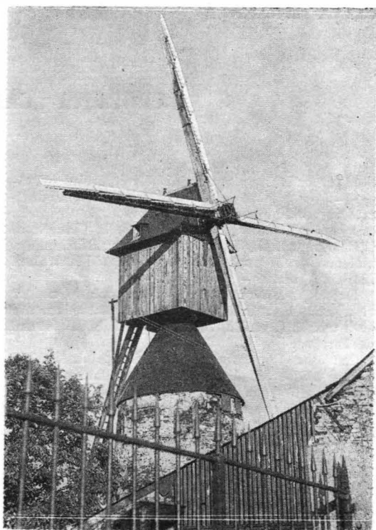
Moara de la Garde, Avrillé-Anjou

„Asociația” propune diferite activități membrilor ei, printre care și vizitarea morilor, pentru cele de apă cu ieșiri