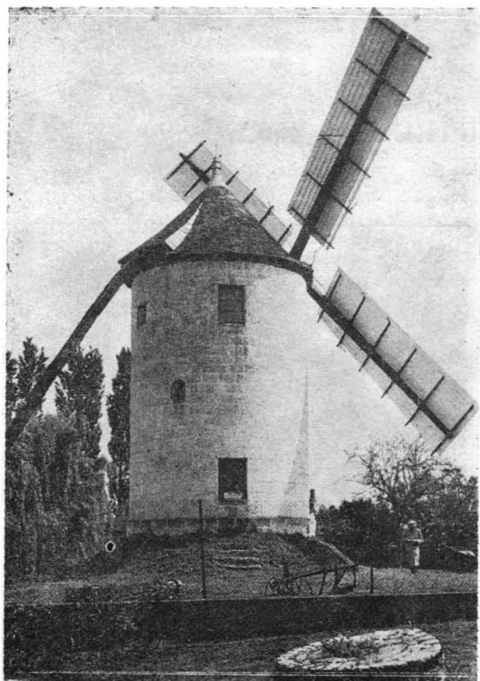
Moara de la Bassez — Terres, les Rosiers-sur-Loire-Anjou