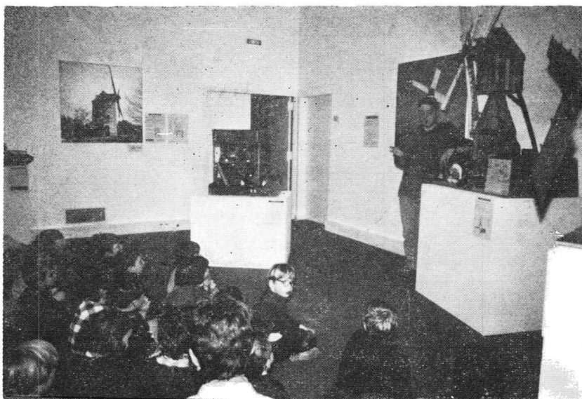
Grup de copii primind explicații în cadrul unei expoziții — Angers, Franța.

blic, nu ca la școală unde elevii sunt obligați (și chiar constrânși) să fie atenți la profesor, ci din interes față de tot ceea ce se spune și ceea ce se vede în expoziție. Aceasta presupune un anumit mod de exprimare și de a atrage atenția vizitatorilor asupra exponatelor etalate pe panouri sau în vitrine. Educatorului de muzeu i se cere, în mod tot obligatoriu, să cunoască toate colecțiile muzeului în care își desfășoară activitatea, indiferent dacă el are pregătirea universitară pentru diversele profiluri pe care colecțiile le au. Acest lucru indică