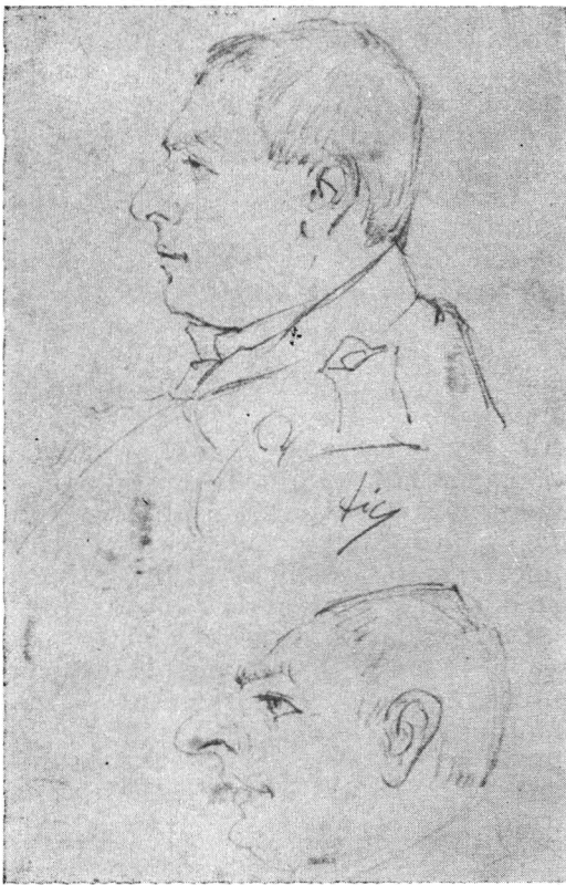
Schiță de portret transformată în caricatură

Un interes psihologic deosebit îl îmboldește pe Alexandru Chirovici să se preocupe de tipuri și caractere. Uneori plecând de la un portret de observație ajunge exagerând trăsăturile la caricatură. Sunt mai multe astfel de reluări ale aceluiași chip, uneori pe aceeași pagină. Un chip ușor bestializat se continuă cu corpul unei maimuțe.