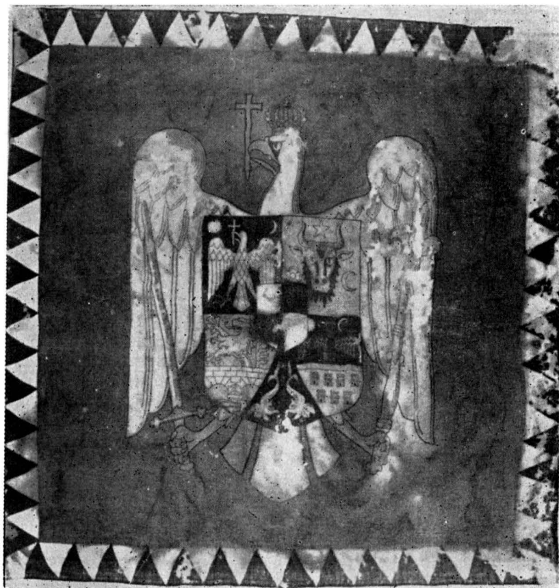
Drapelul ce a aparținut bricului „Mircea”, după restaurare

la origine din țesătură de lână realizată manual, de culoare roșu-vișiniu având imprimată central, stema României, iar pe cele 4 laturi o bordură tot imprimată cu triunghiuri în culorile tricolorului: roșu, galben și albastru.