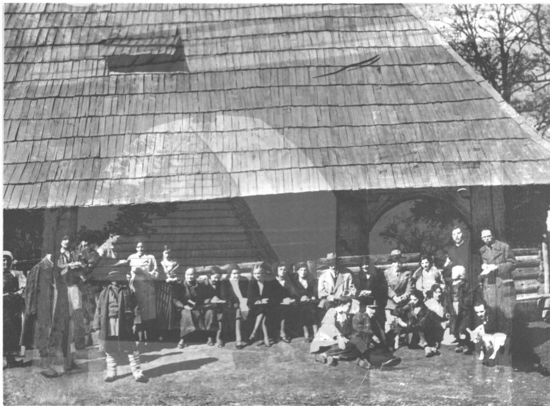
O ședință a Seminarului de etnografie și folclor ținută în Parcul Hoia (perioada interbelică)

răspunsuri din întreaga țară, alături de un fond inestimabil de fotografii, clișee, diapozitive (peste 50.000 de piese), constituie până azi "fondul documentar de aur" al Arhivei etnografice a MUZEULUI ETNOGRAFIC AL TRANSILVANIEI din CLUJ-NAPOCA, elocvent pentru cele trei sferturi de veac de cercetare în arealul carpatic.