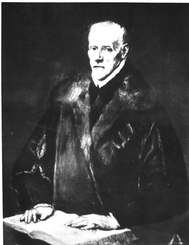
El Greco, "Portretul canonicului Bosio"