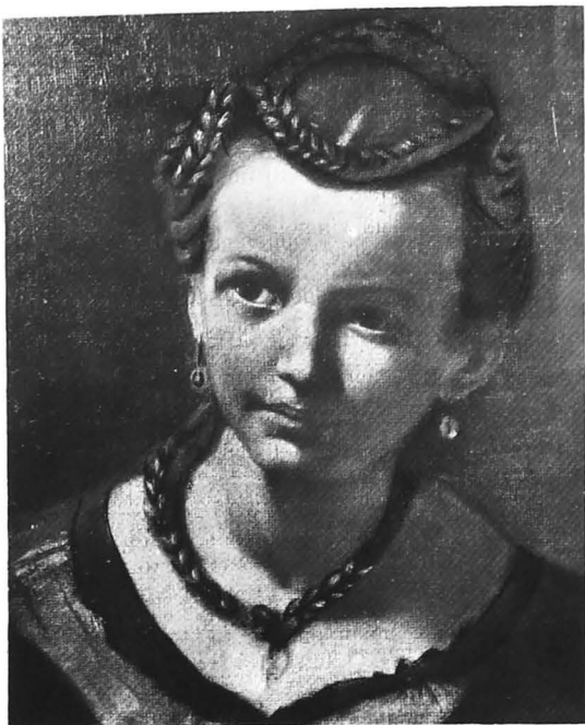
Mattia Preti, "Familia lui Darius oferind coroana lui Alexandru cel Mare" (detaliu)