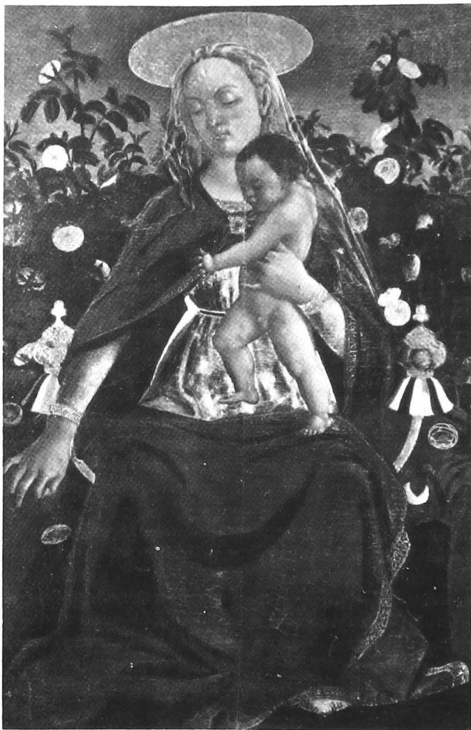
Domenico Veneziano, "Fecioara cu pruncul"

În legătură cu vânzarea tablourilor înregistrate în cel de al doilea catalog manuscris, semnat de Bamberg la Genova – 3 martie 1886 – au fost depistate șase scrisori