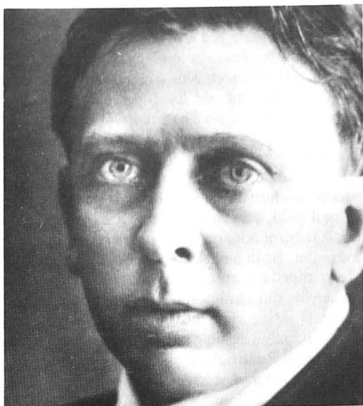
Poetul Octavian Goga sprijinitor al muzeelor bisericești din Basarabia

eparhial. În Raportul de activitate al Consiliului eparhial pe anul 1928, se menționa că "la ordinele date în scopul completării materialului necesar, au început să sosească tot felul de obiecte vechi bisericești, precum icoane, cruci, antimise ș.a. E drept că această colectare se execută cu greu, dar nu e mai puțin adevărat că ea se va îmbogăți" 24 .