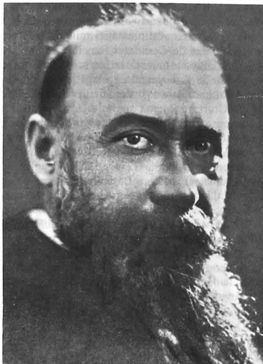
Academicianul Nicolae Iorga

mărturii ale vremurilor trecute să mărească muzeul Societății " 19 .