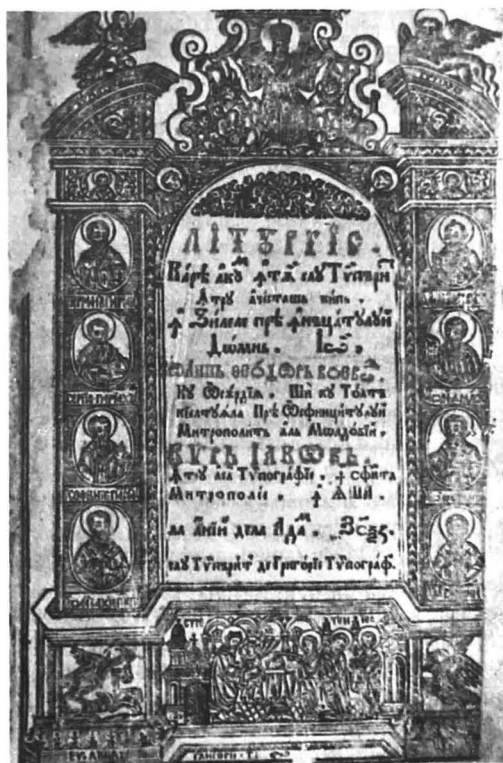
Liturgier tipărit la Iași, 1759

În anul 1918, existau deja în unele localități ale României colecții și nuclee muzeale de profil religios, dar nu exista un muzeu al întregii țări. După Unire se întreprind demersuri pentru instituirea unui așezământ muzeal bisericesc care să reflecte istoria Bisericii Ortodoxe Române din întregul areal românesc. În anul 1922, Șt. Berechet propunea realizarea unui asemenea muzeu. El avea convingerea că un astfel de muzeu " va căuta să adune la un loc toate rămășițele trecutului nostru bisericesc ca: veșminte, icoane, schițe de picturi murale, planuri de biserici și mănăstiri vechi, fotografii din diferite poziții ale acestor lăcașuri sfinte, care cad în ruină și nu se mai pot menține cu