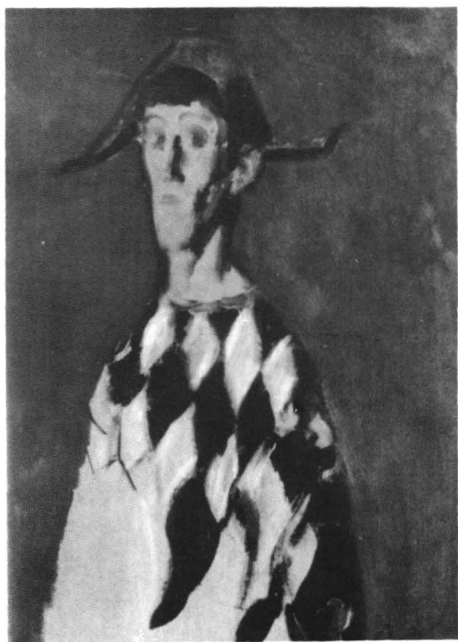
Corneliu Baba, Arlechin (studiu) , 1985, tehnică mixtă, Colecția artistului

o captează și temperaturile înalte ale procesului în cursul căruia lumea devine strat luminos al eului său plin de tenebre, ne ard nouă ochii, privitorilor tabloului, după întîlnirea cu care ne este peste puțină să mai vedem altfel decît pictorul lumea, a vreme: orbiți de lumina ei, triști de bezna noastră. Nu vreau să am aerul că scriu sub imperiul emoției (puternice, de fapt, aproape de nesuportat, pe care ți-o dă conspectarea zecilor de opere în care descifrezi pe rînd această alchimie), dar elementele judecății critice pornesc întotdeauna o valabilă, de la „ elebniss ”-ul estetic, și trăirea unei opere e în primul rînd de ordin emoțional. Abia în al doilea, de ordin reactiv, și-n urmă și dispozițional. Obiectiv, cînd devine, procesul are la bază lava, atunci răcită, dar păstrînd în ea direcția cursului vijelios din vremea cînd era incandescentă, și asta dă judecății valoarea ei, și-o face autentică. Altfel, critica ar fi doar codificare și decodificare, ocupație cibernetică, impersonală ca umblatul în tablele de logaritmi, și extranee sufletului orîșicui. Nu poți vorbi de viață decît pomînd de la viață.