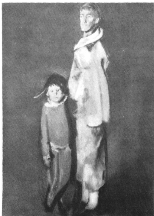
Corneliu Baba, Carnaval , 1982, ulei pe pânză, Colecția artistului