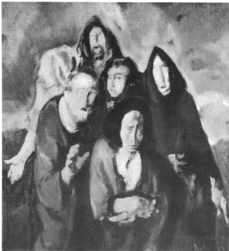
Corneliu Baba, Spaima , (Omaggio lui Francisco Goya) 1987, ulei pe pânză, Colecția artistului