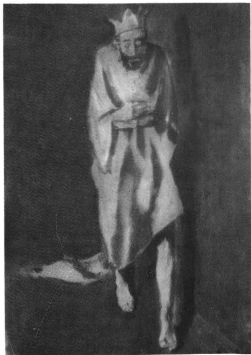
Corneliu Baba, Regele nebun , 1981, ulei pe carton, Colecția artistului