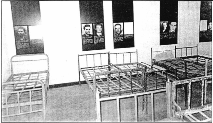
Sala „Lotul Vișovan“

Ceea ce atrage atenția vizitorului, încă din primul moment, este o hartă mare a țării pe care sunt punctate, prin cruci, cele peste 250 de locuri de detenție, de muncă forțată și de domiciliu obligatoriu, azile psihiatrice și gropi comune. Fiecare din acestea se regăsește, apoi, pe șase hărți mici, unde sunt enumerate toate aceste locuri. Alături de hărți se găsesc pozele celor mai importante închisori comuniste.