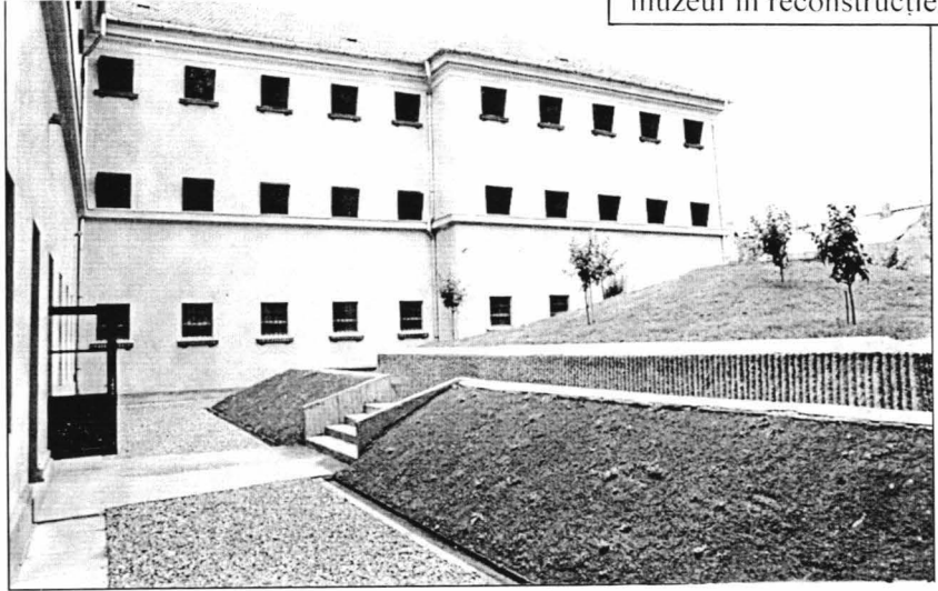
Memorialul Victimelor Comunismului și al Rezistenței de la Sighet, curtea interioară unde se află Spațiul de Reculegere și Rugăciune

În 1955, ca urmare a Convenției de la Geneva, închisoarea de la Sighet a redevenit locul de ispășire a pedepsei pentru deținuți de drept comun.