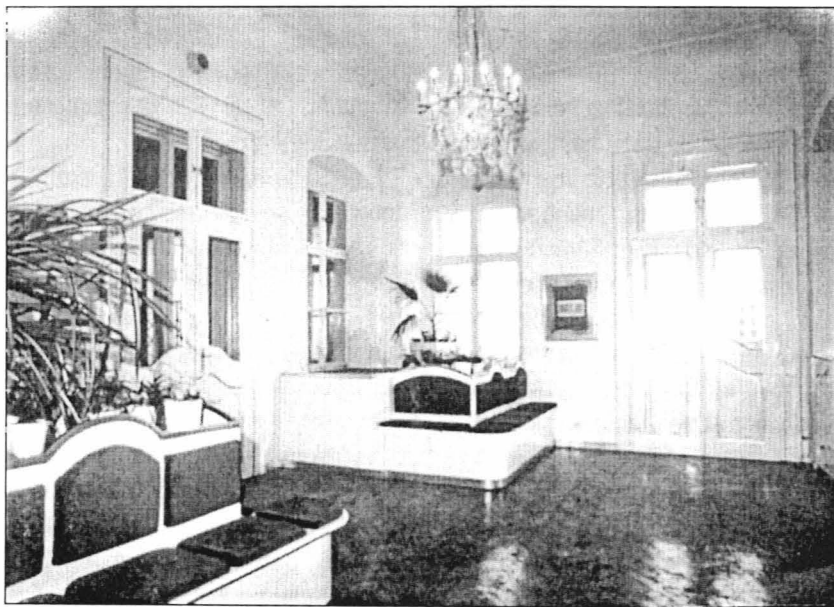
Aspect din Muzeul Național de Artă Cluj