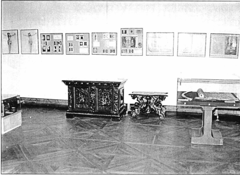
Sala de Onoare. Mobilier, postere (restaurare steaguri, statuie lemn), vitrină (sabie, textilă cu fire metalice).

În comparație cu conservatorii și restauratorii care publică în anuare, cei care publică în paginile Revistei muzeelor nu sunt numeroși (fie de la muzele județene, fie de la laboratoare zonale cu tradiție). Articolul de față nu-și propune cercetarea cauzei sau motivației acestei stări de fapt, ci, plecând de la constatarea situației, să atenționeze și să se constituie în punte de legătură între cei care publică în anuare și cei care publică în Revista muzeelor .