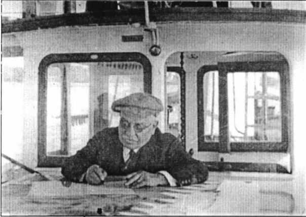
Grigore Antipa, la bordul vaporului „Razelm”, în drum spre Delta Dunării