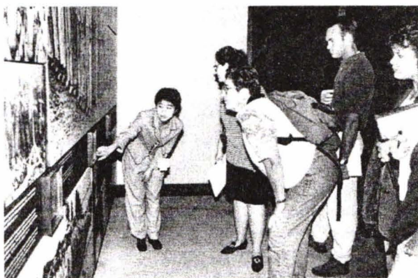
Imagine din Muzeul Holocaustului

Sala rememorării este un adevărat templu în care arde flacăra eternă, simbolizînd memoria națională americană în numele victimelor Holocaustului. Ea face trecerea din expoziție în spațiul liniștii, de la istorie la memorie. În preajma scărilor ce conduc vizitatorului spre holul martorilor, se află o sală de studiu special amenajată și dotată cu mai multe calculatoare. Ea oferă posibilitatea oricărui vizitator să revadă pe cont propriu imagini, hărți, date demografice, informații cu privire la istoria nazismului, lagărele morții, genocid, precum și să beneficieze de material informativ tipărit. Marele hol al martorilor de la intrarea în muzeu, locul unde este amplasată și expoziția lui Daniel, perspectiva unui copil asupra Holocaustului în Germania nazistă, încheie circuitul muzeistic. El este, probabil, spațiul cel mai încărcat de mesaje, prin care arhitectul trimite spre lumea închisă și perversă a nazismului.