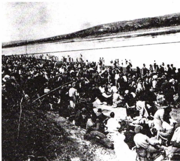
Deportarea peste Nistru

Piatra de temelie a Muzeului Holocaustului a fost pusă la 16 octombrie 1985. Elie Wiesel spusese cu acel prilej că "piatra de temelie înseamnă începutul înțelegerii dimensiunii fizice a rememorării suferinței noastre". Construcția în sine a atras dezbateri