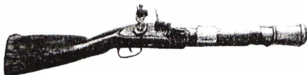
Carabină Tra,bleau, cu cremene, sec. XVIII

Una din direcțiile pentru înzestrarea armatei cu armament și echipament a constituit-o dezvoltarea industriei naționale de apărare, de accesorii, muniții și reparare a mijloacelor de luptă. Pentru conducerea și organizarea activității întreprinderilor de profil a fost creată, începând de la 26 august / 7 septembrie 1861, Direcția stabilimentelor de artilerie. Aceasta cuprindea trei secții, cărora li se subordonau: Pirotehnia din București, Arsenalul de construcții și Fabrica de pulbere de la Târgșor (Ploiești). Din 1863, se mai înființează pe lângă Arsenalul armatei din Dealul Spirii o "manufactură de arme". Dintre lucrările mai importante executate aici menționăm: transformarea unei părți din puștile cu cremene, aflate în dotarea trupelor române în deceniile anterioare, în puști cu percuție; ghiltuirea puștilor cu capsă; producerea, din 1863, a primelor prototipuri de puști și pistoale românești cu capsă. Necesarul de