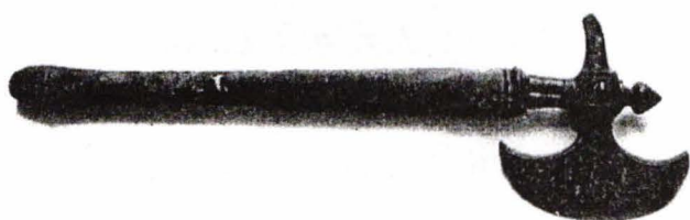
Secure de călăreț (de panoplie), sec XVI

În prima jumătate a secolului al XVII-lea, odată cu sporirea puterii de