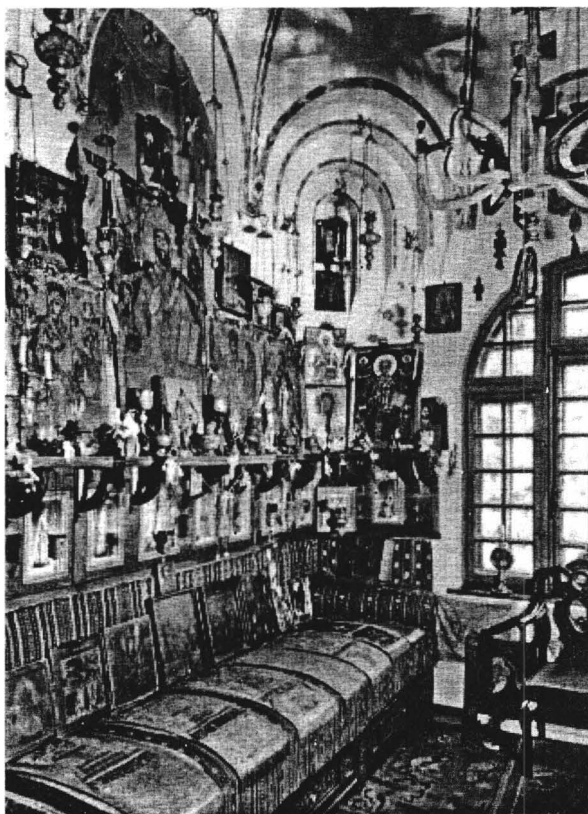
Imagine din capelă (1937).

În ceea ce privește ceramica, cea ardelenească este deosebit de bine reprezentată. Sunt prezente străchini de Făgăreș care, pe un fond alb, au în mijloc motiv floral, iar ca bordură, în albastru și verde, crenguțe de brad stilizate; cele din regiunea Sibiului, au borduri cu verde, albastru și brun, iar la mijloc, flori sau păsări stilizate; ceramica de Brașov, albă, pictată sau desenată cu cornul cu albastru, precum ceramică săsească, albastru de cobalt,