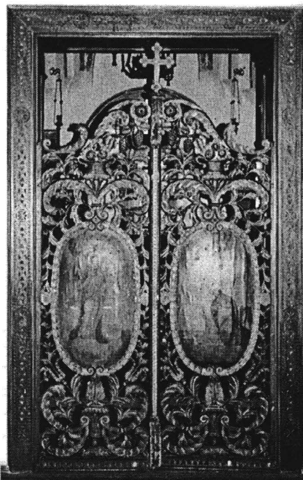
Porți împărătești aduse de la o biserică ortodoxă de lângă Orșova (sec. 18). Imagine din muzeu.

Cele peste 400 de ouă încondeiate, adunate din întreaga țară, poartă specificul regiunii de origine, atât în ceea ce privește culoarea, cât și desenul, precum: talpa găștii, cuișoare, traista ciobanului, crenguțe de brad, steluța, etc. 10