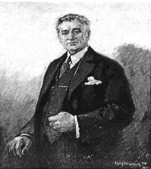
Dr. Nicolae Minovici - portret realizat în 1936 de Costin Petrescu. (foto stanga)

În 1898, Nicolae Minovici obține titlul de doctor în medicină, cu lucrarea „Tatuajurile în România”, publicată în același an. Această temă era abordată pentru prima oară în România și așa a rămas până astăzi. Ca student, a lucrat mai întâi ca desenator și preparator al sălii de disecție, apoi al clinicii și Institutului de chirurgie și ginecologie. În tot timpul studiilor, a ocupat și posturile de preparator, apoi de asistent la catedra de histologie.