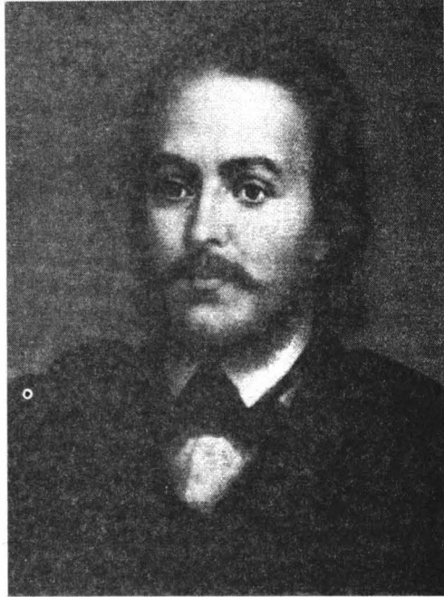
Gheorghe Lazăr (1779-1823), întemeietorul învățământului superior în limba română