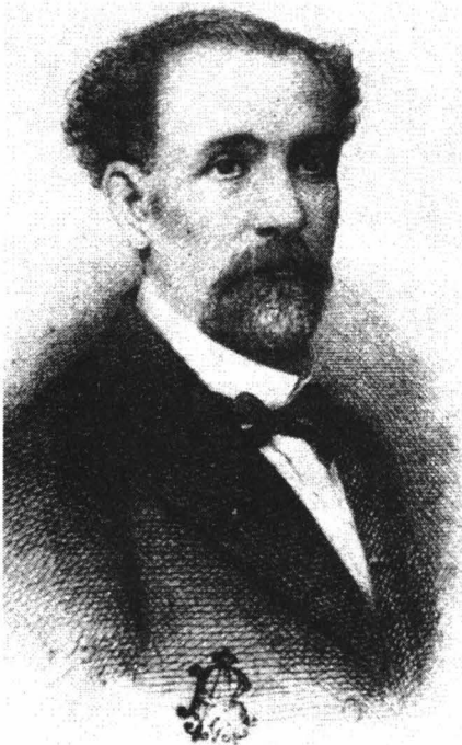
Vasile Boerescu (1830-1883), profesor de drept, ministru al Instrucțiunilor Publice