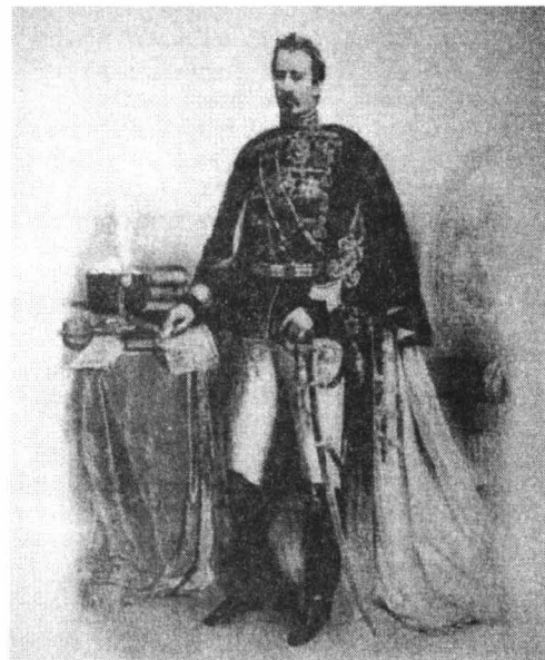
Carol Popp de Szathmari, Domnitorul A. I. Cuza (1859-1866), litografic, secolul XIX