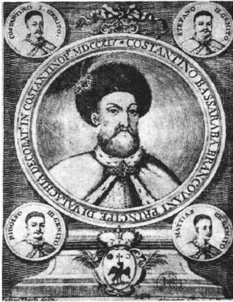
Constantin Brâncoveanu (1688-1714)